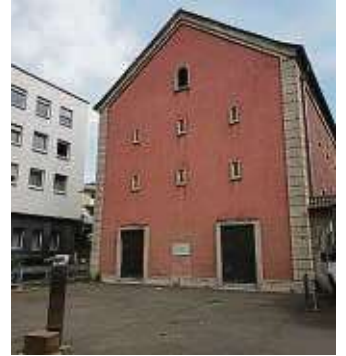
Wo der Bunker steht, befand sich eine Synagoge.

beim Neuen Theater Höchst einlege. In dem ehemaligen Kinosaal kommen Fans der Kleinkunst auf ihre Kosten. Im ersten Stock befindet sich der Kinosaal des Filmforums Höchst.