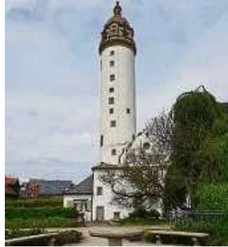
Das Alte Schloss mit seinem markanten Turm.

Weiter geht's zum Dalbergplatz, einem wichtigen Verkehrsknoten. In der Mitte des Kreisverkehrs glitzert die silberne Skulptur „Windsbraut“ in der Sonne, an der einmündenden Hostatostraße steht das Glockenspielhaus - die Glocken an der Fassade über der Uhr sind nicht zu übersehen. Im Inneren des Hauses befindet sich das Frankfurter Uhren- und Schmuckmuseum. Ich folge der Hostatostraße und passiere die katholische Kirche St. Josef, bevor ich über die Justinskirchstraße und Emmerich-Josef-Straße einen kurzen Stop