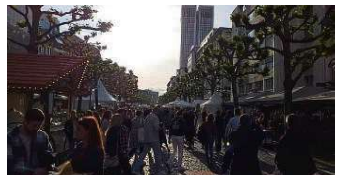
Die Imbiss-Buden und Getränkestände hatten internationale Küche und leckere Weine zu bieten.