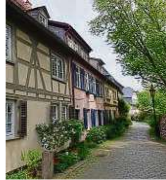
Idyllische Fachwerkhäuser zieren den Burggraben.