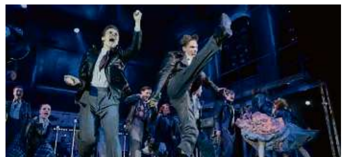
Das Musical rockt die Alte Oper.

Die Filiale Kaufhof Frankfurt Hauptwache ist von der Schließung nicht betroffen und ist weiterhin geöffnet