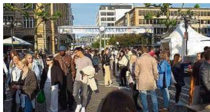
Gut besucht: Besonders am Wochenende strömten die Frankfurter auf das beliebte Fest.

Die Stadt hat eine weitere Übergangsunterkunft für geflüchtete Menschen in Betrieb genommen. Das ehemalige Hotel in Bockenheim verfügt über 83 Wohneinheiten und bietet bis zu 200 Menschen Platz.