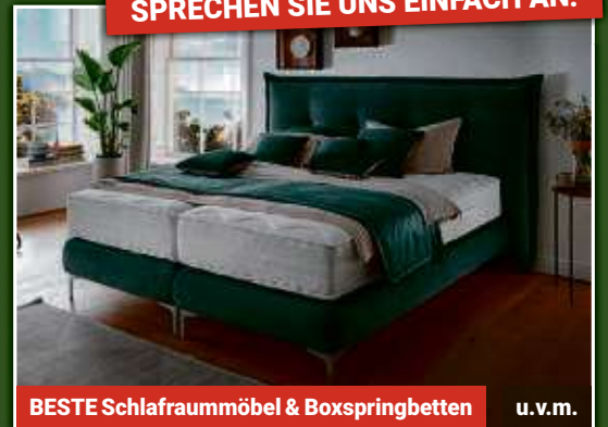
BESTE Schlafraummöbel & Boxspringbetten u.v.m.

Keine Haftung für Druckfehler. Irrtümer vorbehalten. Alle Abb. sind Musterbeispiele. 1) Gilt auf unseren Listenpreis. Ausgenommen Abverkaufsartikel und Werbeware, die im Haus als solche gekennzeichnet sind. Gilt nicht für die in unseren Prospekten beworbenen Artikel. Keine Barauszahlung möglich. 2) Stand: 16.04.2023, 6091 Befragungen. Ermittelt mit einer in Auftrag gegebenen Kundenbefragung in der Zeit vom 04.06.2017 bis 16.04.2023 durch das privatwirtschaftliche Institut SERVICE-CHECK Institut GmbH, Bürgerfeld 65, 85570 Markt Schwaben. Bewertet wurden die Antworten von 6091 befragten Kunden von Flamme Möbel.