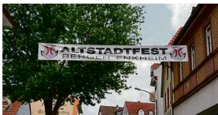
Das Altstadtfest, das Fest der Bergen-Enkheimer Vereine, findet auf dem Schelmenburgplatz und Teilen der Marktstraße statt.

Weiter geht's am Sonntag, 4. Juni. Dann startet ab elf Uhr das bunte Markttreiben auf der Marktstraße, bei dem sich Vereine, Gewerbetreibende und Gastronomen sowie Hobbyaussteller präsentieren. Spiel und Spaß sowie Getränke und Spezialitäten werden auf der Festmeile angeboten. Kinderkarussells und Musikdarbietungen sind ebenso Programmbestandteile wie Kinder- und Mitmachaktionen. Auch eine Fahrradcodierung wird angeboten.