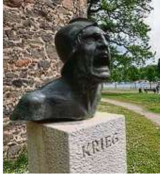
Der stumme Schrei der Skulptur macht beklemmt.