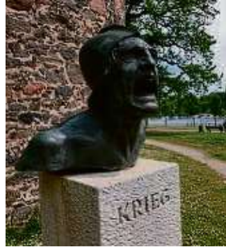
Der stumme Schrei der Skulptur macht beklemmen.