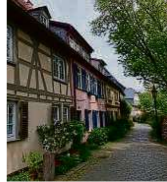
Idyllische Fachwerkhäuser zieren den Burggraben.