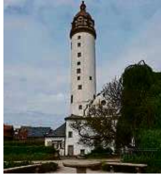
Das Alte Schloss mit seinem markanten Turm.

Weiter geht's zum Dalbergplatz, einem wichtigen Verkehrsknoten. In der Mitte des Kreisverkehrs glitzert die silberne Skulptur „Windsbraut“ in der Sonne, an der einmündenden Hostatostraße steht das Glockenspielhaus - die Glocken an der Fassade über der Uhr sind nicht zu übersehen. Im Inneren des Hauses befindet sich das Frankfurter Uhren- und Schmuckmuseum. Ich folge der Hostatostraße und passiere die katholische Kirche St. Josef, bevor ich über die Justuskirchstraße und Emmerich-Josef-Straße einen kurzen Stop