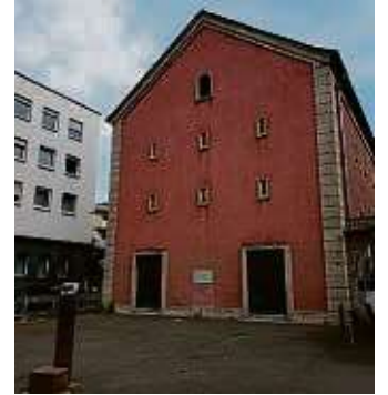
Wo der Bunker steht, befand sich eine Synagoge.

beim Neuen Theater Höchst einlege. In dem ehemaligen Kinosaal kommen Fans der Kleinkunst auf ihre Kosten. Im ersten Stock befindet sich der Kinosaal des Filmforums Höchst.