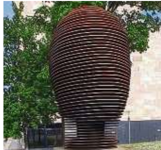
Ein riesiger Kopf in Scheiben steht neben dem Hörsaalzentrum.