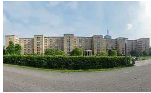
Das IG-Farben-Haus mit Rotunde in der Mitte – vom inneren Teil des Campus' aus gesehen.