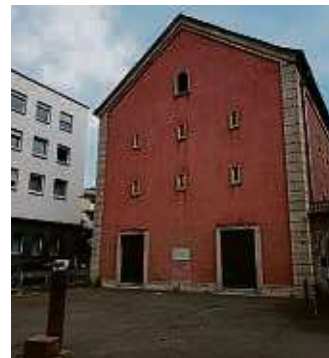
Wo der Bunker steht, befand sich eine Synagoge.

Ich begeben mich wieder zurück an den Main, denn als Nächstes stehen die Niddamündung und der Bolongaropalast auf der Liste. Über die Nidda führt das „Gaasebrückelsche“ (Ziegenbrücklein), von dem aus man ei-