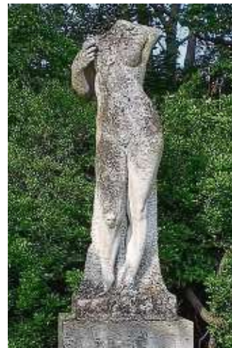
Eine der Statuen auf dem Gelände.