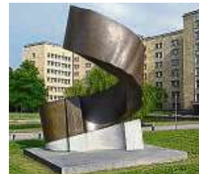
Beeindruckend: Am Brunnen steht der künstlerische Trumm.