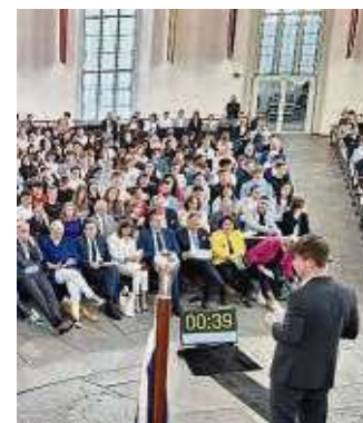
Viel Prominenz bei der Veranstaltung – plus 600 Schüler.