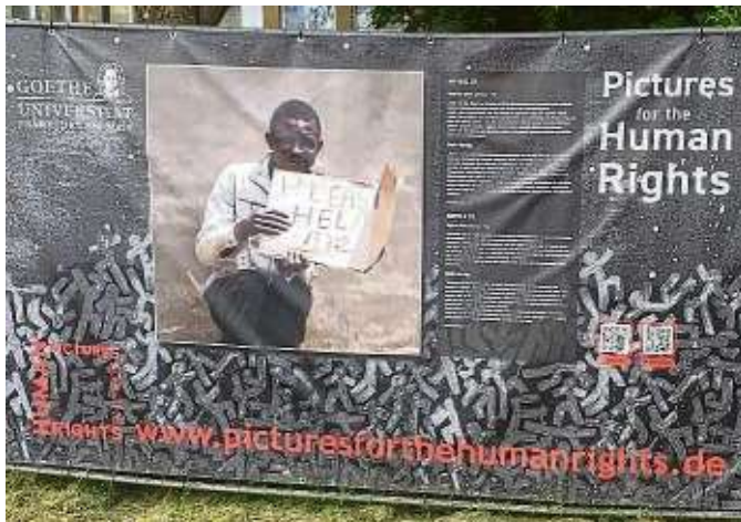
Den 30 Artikeln zur Allgemeinen Erklärung der Menschenrechte haben sich Künstler mit Bildern gewidmet.

Es lohnt sich definitiv, einmal auf Erkundungstour zu gehen auf dem Campus Westend. Derzeit etwa ist auch die Wander- und Freiluft-Ausstellung „Menschenrechte“ vor dem Haupteingang zum IG-Farben-Haus zu sehen. 30 Kunstwerke widmen sich auf Planen der