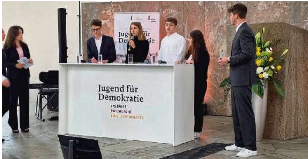
Schüler aus 23 Frankfurter Schulen beteiligten sich an den Diskussionen