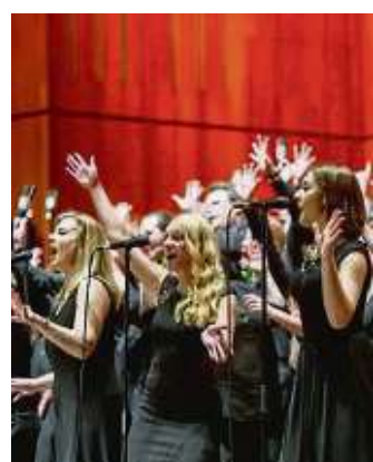
Beim Konzert sollen die 200 Stimmen gemeinsam erklingen.

Frankfurt (red) – Nach vielen erfolgreichen Projekten in ganz Deutschland ruft das „Sing Out-Mass-Choir“-Projekt von Silas Edwin Sänger aus Frankfurt auf, dabei zu sein, wenn sich 200 Stimmen vereinen, um auf einem Konzert im Sendesaal des HR Frankfurt eine Musikexplosion zu präsentieren. Angesprochen sind alle, die das Singen lieben, erfahrene und unerfahrene Sänger aller Altersklassen, die mit Spaß, Musik und Emotionen Lieder von Pop bis Gospel, Rock über Soul einstudieren wollen. Viele Musikrichtungen werden