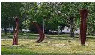
Überall am Campus zu finden: Moderne Kunst.