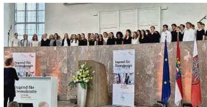
Der Chor der Musterschule sorgte für den musikalischen Teil.