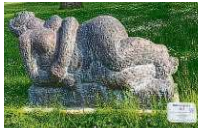
An manchen Kunstwerken gibt es aber auch Schildchen mit Beschreibungen.