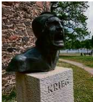
Der stumme Schrei der Skulptur macht beklemmen.

Auf dem Weg zur Rudolf-Schäfer-Anlage passiere ich das Hallenbad Höchst und die evangelische Stadtkirche. Am Rand der Anlage posiert Bismarck als Denkmal, während auf der gegenüberliegenden Seite der Bolongarostraße die moderne Skulptur „Transformation“ platziert ist: Auf einer Bank sitzt ein Wesen, das halb Mensch, halb Engel ist. Ein Flügel ist zugleich die Rückenlehne der Bank. Ein interessanter Kontrast zu dem „Eisernen Kanzler“.