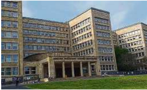
Der Haupteingang der Goethe-Uni: Rechts und links davon ist die Menschenrechte-Ausstellung zu sehen.