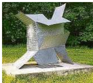
Es bleibt Raum für Interpretation.