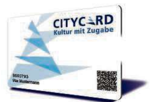
Die Kultur-Vorteilskarte für Frankfurt und Rhein-Main ermöglicht Vergünstigungen.

Vielzahl an Veranstaltungen, bei denen sie zwei Tickets zum Preis von einem erhalten. Die City Card ist online für 24 Euro jährlich erhältlich auf citycard.de . Das Frankfurter WochenBlatt verlost