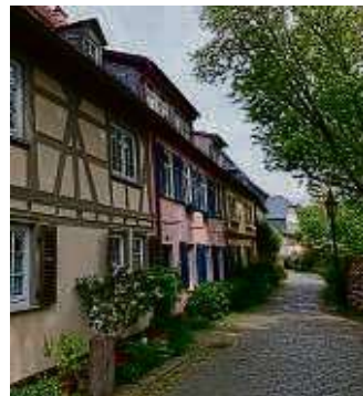
Idyllische Fachwerkhäuser zieren den Burggraben.

Die Bolongarostraße bringt mich erst einmal zum Dalberghaus. Das hübsche historische Anwesen beherbergt das Evangelische Familienzentrum Höchst, eine Cembalo-Werkstatt und in den unterirdischen Gewölben den Kulturkeller Höchst, in dem Kleinkunst geboten wird. Ich werfe noch einen Blick auf das neue Schloss Höchst, das vermutlich einst aus zwei kleinen Adelssitzen hervorging. Der Gebäudekomplex diente, nachdem das Alte Schloss zu Beginn des Dreißigjährigen Kriegs zerstört wurde, den Mainzer Kurfürsten als gelegentliches Quartier, bis es Ende des 18. Jahrhunderts in Privatbesitz kam und durch mehrere Hände ging. Durch den malerischen Burggraben mit seinen bunten Fachwerkhäusern, alten Laternen, blühender Bepflanzung und Kopfsteinpflaster mache ich mich auf den Weg zum Alten Schloss, das im Mittelalter eine Zollburg des Mainzer Erzbischofs war. Das Gebäude mit dem markanten haubenförmigen Dach auf dem Turm gehört inzwischen der Deutschen Stiftung Denkmalschutz. Das Höchster Schlossfest ist einer der kulturellen Höhepunkte der Region. Auf dem Schlossplatz ist auch ohne Fest schon mächtig was los. Zahlreiche Ausflügler genießen