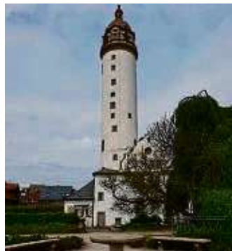
Das Alte Schloss mit seinem markanten Turm.

Weiter geht's zum Dalbergplatz, einem wichtigen Verkehrsknoten. In der Mitte des Kreisverkehrs glitzert die silberne Skulptur „Windsbraut“ in der Sonne, an der einmündenden Hostatostraße steht das Glockenspielhaus - die Glocken an der Fassade über der Uhr sind nicht zu übersehen. Im Inneren des Hauses befindet sich das Frankfurter Uhren- und Schmuckmuseum. Ich folge der Hostatostraße und passiere die katholische Kirche St. Josef, bevor ich über die Justinskirchstraße und Emmerich-Josef-Straße einen kurzen Stop