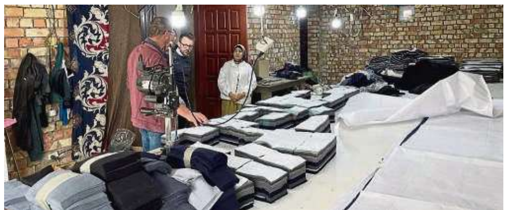
In der Näherei machen sich die Besucher ein Bild vom erfolgreichen Einsatz der Spendengelder.

Es warten also noch einige Aufgaben, und glücklicherweise sei auch noch Geld vorhanden, so der Bericht. Für das nächste Jahr ist wieder ein Besuch geplant. Die Dolmetscherin der deutschen Botschaft habe es so zusammengefasst: „Es ist eine wirkliche Erfolgsgeschichte, die die starke junge Frau schreibt. Wir erleben hier etwas, was man leider nicht oft sieht. Hilfe, die von Herzen kommt, wird dankbar aufgenommen, kommt wirklich an und zeigt Wirkung.“ jow