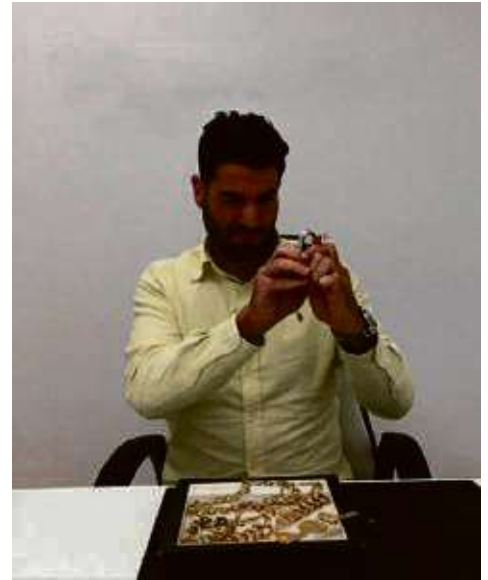
Ihr Spezialist für Goldankauf.