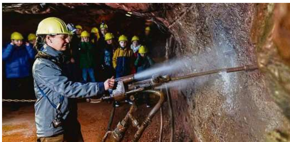
Über und unter Tage gibt es morgen beim Schmelz- und Schmiedetag in der Geowelt Fortuna in Solms-Oberbiel viel zu sehen.