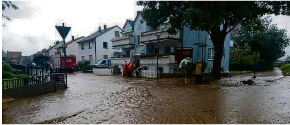
Im Juni 2016 ging über Mittelbuchen ein Starkregen nieder. Ein Frühwarnsystem soll künftig Bürger rechtzeitig auf solche Ereignisse vorbereiten.