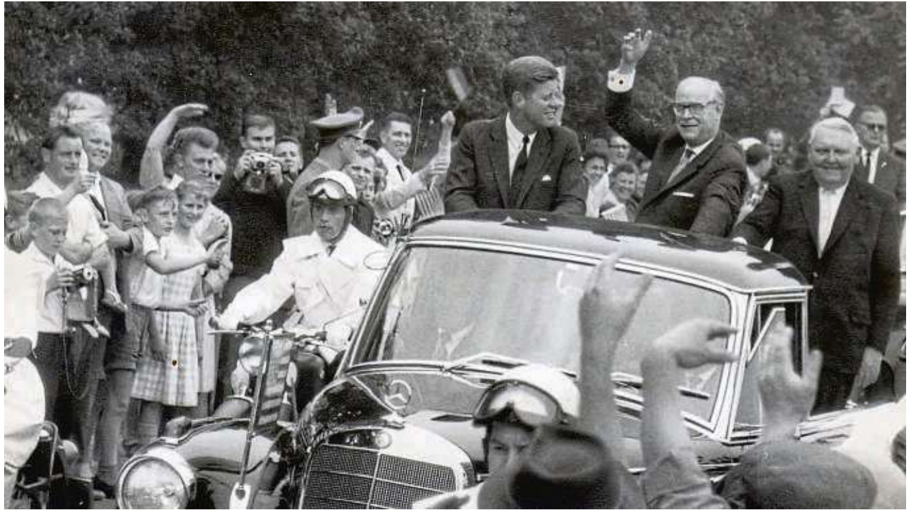
Tausende säumten die Straßen: In einem offenen Mercedes Pullmann fuhr der US-Präsident (von links) in Begleitung des damaligen hessischen Ministerpräsidenten Georg August Zinn und Vizekanzler Ludwig Erhard nach Frankfurt.

Genau wie der erste Schritt eines Amerikaners auf dem Mond wurde auch Kennedys erster und einziger Besuch in Deutschland minutiös protokolliert. Es soll genau 10.29 Uhr gewesen sein, als der Amerikaner seinen Fuß auf die Landebahn des Fliegerhorsts setzte. Er entstieg dem letzten von vier Hubschraubern, die zuvor auf dem Geviert vor der damaligen Kasernensporthalle in Langendiebach aufgesetzt hatten. Mit 21 Salutschüssen wurde der damals mächtigste Mann der Welt begrüßt. 15000 US-Soldaten standen in Reih' und Glied. 1000 Fahrzeuge, darunter 600 Panzer, bildeten eine beeindruckenden