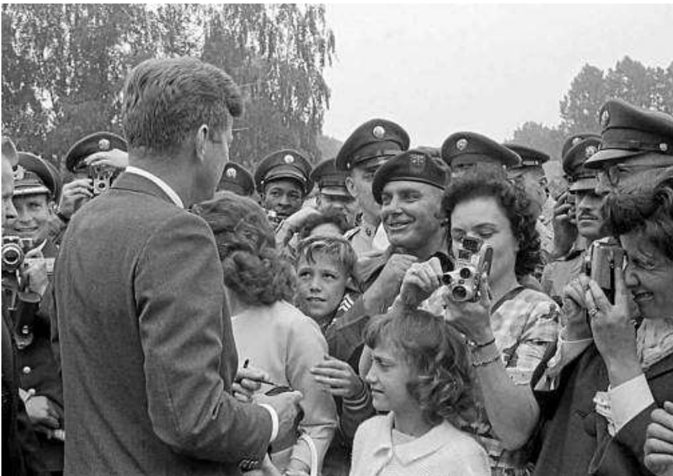
Für viele ein unvergesslicher Augenblick: Der Präsident nimmt ein Bad in der Menge.