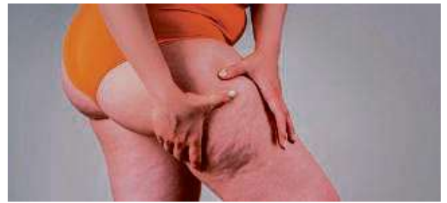
Abnehmen trotz Lipödem mit der Unterstützung von easylife.

Das Team von easylife, zu dem neben den Ernährungsberatern auch medizinisches Personal gehört, begleitet eine gesunde Abnahme auch bei Menschen, für die das Erlangen eines gesun-