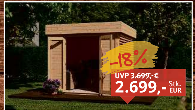
Gartenhaus Homeoffice Ivar 28 mm naturbelassen Fichte naturbelassen, B x T x H: 277,6 x 283,5 x 248 cm, inkl. große Fensterfront