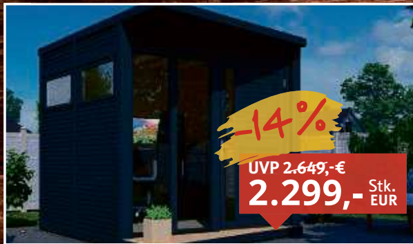
Gartenhaus Futura Premium 19 mm anthrazit Fichte, lackiert/lasiert, B x T x H: 234 x 303 x 227 cm, Sockelmaß Haus: 234 x 225 cm, inkl. Boden + Dachpappe zur Ersteindeckung