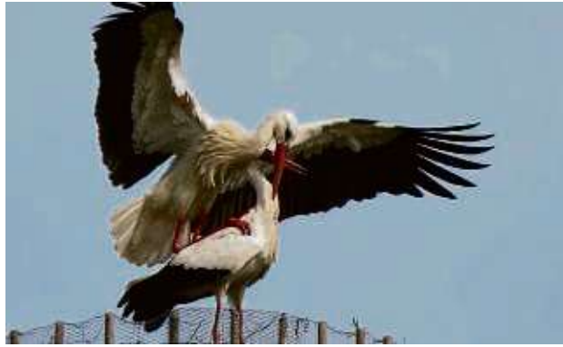
Mit dem Fernglas oder einem Teleobjektiv lässt sich das Storchennest auch aus der Distanz beobachten.

Auf den Wiesen können die Weißstörche ausreichend Nahrung finden. Dabei jagt der langbeinige Vogel nicht mehr nur Frösche und andere Amphibien, wie es früher der Fall war. Viele Feuchtgebiete sind ausgetrocknet und damit wurde den Störchen diese Nahrungsquelle genommen. Auch die Ausdehnung der Siedlungs- und Gewerbeflächen sowie der Straßenbau und die Absenkung des Grundwasserspiegels hätten dazu geführt, dass die letzte Brut des vergangenen Jahrhunderts im Kreis Offenbach 1968 in Seligenstadt beobachtet worden sei. „Der Storch war Mitte der 1970er Jahren in Hessen fast ausgestorben.“ Doch mittlerweile gebe es im Kreis wieder sieben bis acht Brutpaare. Das Tier habe sich angepasst und fresse nun auch Würmer, Mäuse und auch Jungvögel. Auf der Suche nach