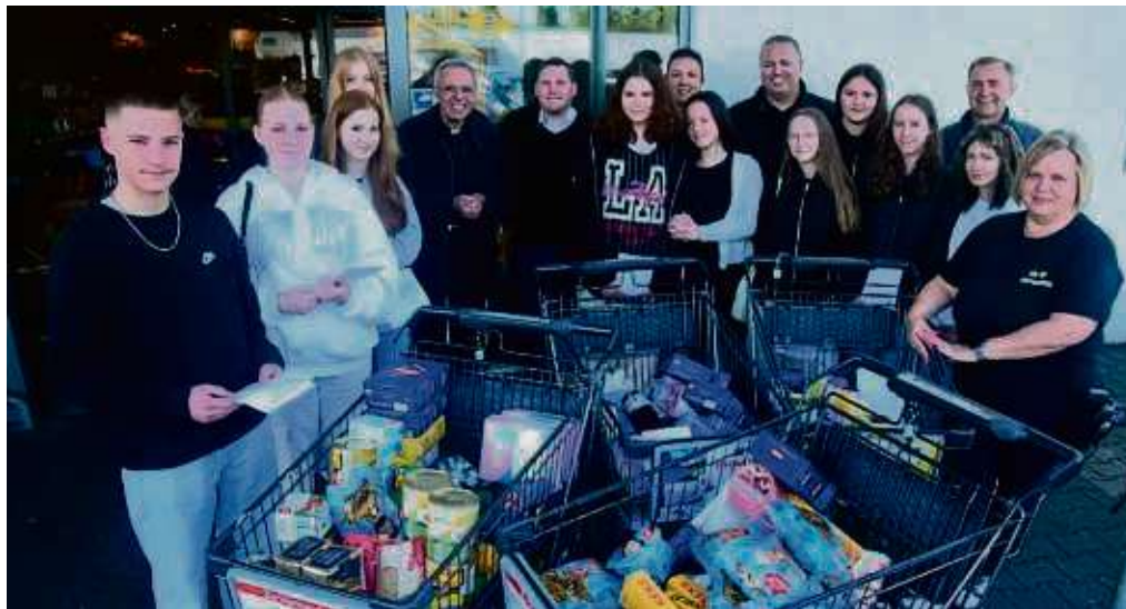
Auf große Resonanz stieß die Hilfsaktion der Firmlinge am Edeka-Markt Deckenbach. Sie hatten Kunden gebeten, für die Ukrainehilfe einzukaufen.

Er bittet auch um Anti-Mücken- und -Zecken-Präparate, Erste-Hilfe-Sets, Verbandmaterial und Schmerzmittel und um medizinische Geräte.