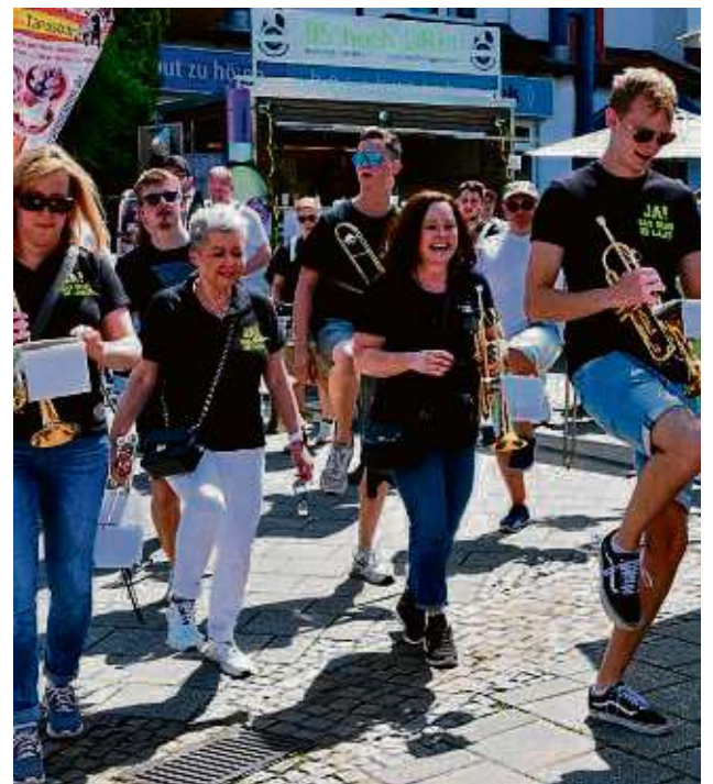
Die Druffkapell aus Jügesheim – laut und schräg.

mens im Jahr 2014 stehen nach Worten der Regisseurin vor Ort genug Standbetreiber zur Verfügung, um auch Doppel- oder Dreifachtermine zu stemmen. Immer komme die Genuss-Karawane mit eigenem Team für Strom und Wasser, Schichtleitern für die Kontrolle und eigener Aufräum- und Putzmannschaft. Dass das Konzept funktioniert, lässt die Zahl von Stamm-Standorten vermuten – auch in der Region: Streetfood-Festivals finden inzwischen regelmäßig unter anderem in Dieburg, Groß-Gerau, Langenselbold, Hofheim und Rüdelsheim statt. Größte Veranstaltung in der näheren Nachbarschaft ist laut Veranstalter das jährliche Gastspiel in Alzenau. Am kommenden Wochenende werden die Stände übrigens quasi in Rufweite aufgebaut: am Mainufer in Seligenstadt. zrk