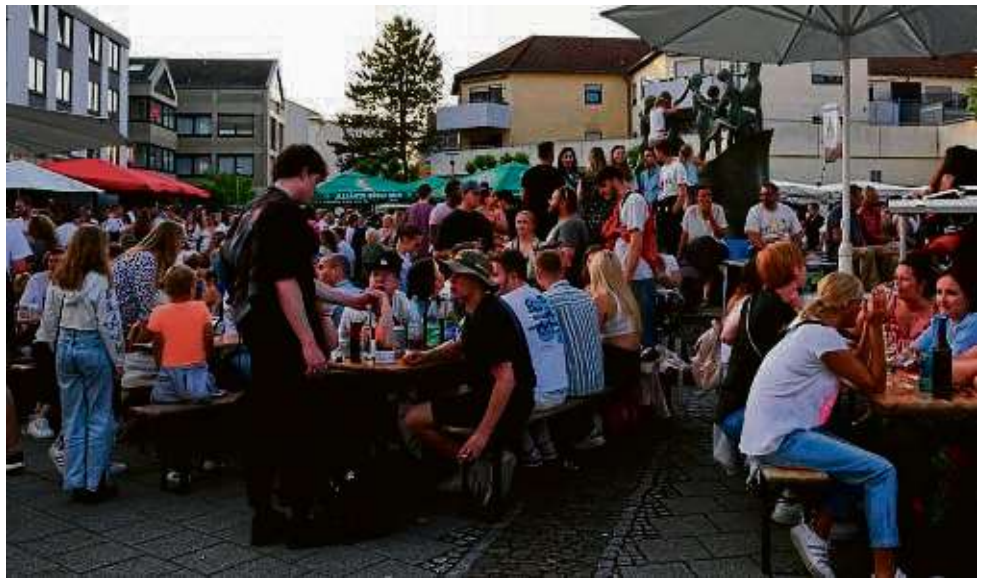
Tische und Bänke restlos besetzt, alle Stände – insgesamt ein gutes Dutzend – unter Dampf.

Dr. Hermann-Neubauer-Ring 38 – 40 • 63500 Seligenstadt Tel.: 06182 - 8208 - 0 • info@kruthoffer-kanzlei.de