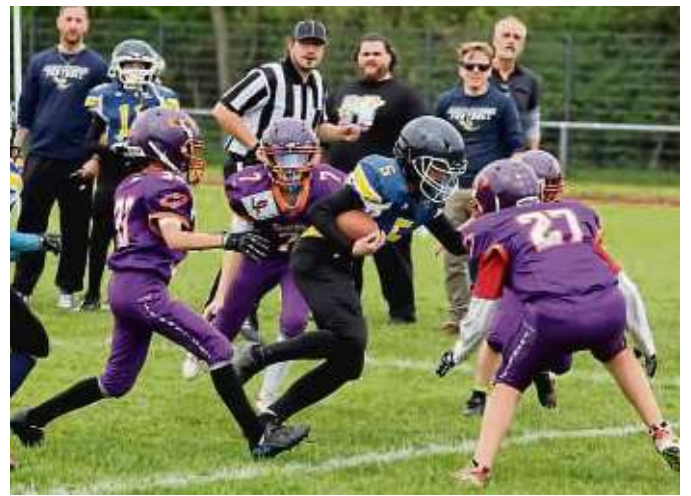
Vier U13-Teams nahmen am American-Football-Turnier teil.

Einen Turniersieg gab es für die F2-Junioren, die sich im Finale mit 4:1 nach Siebenmeterschießen gegen die TSV Heusenstamm durchsetzten. Bei den E-Juniorinnen im Modus „Jeder gegen jeden“ kamen die Gastgeberinnen mit elf Punkten hinter der TSG Frankfurt (13) auf den zweiten Platz. Den zweiten Rang belegten auch die E1-Junioren, die im Finale dem FC Freudenberg mit 0:2 unterlagen. Die G1 und die E2 sorgten mit ihren dritten