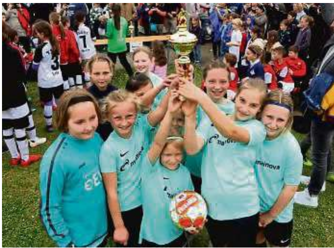
Stolz auf den zweiten Platz: E-Juniorinnen der SKG.