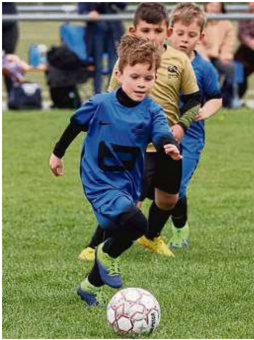
Volle Konzentration: G2-Jugend der SKG (blaue Trikots) gegen OSC Rosenhöhe.