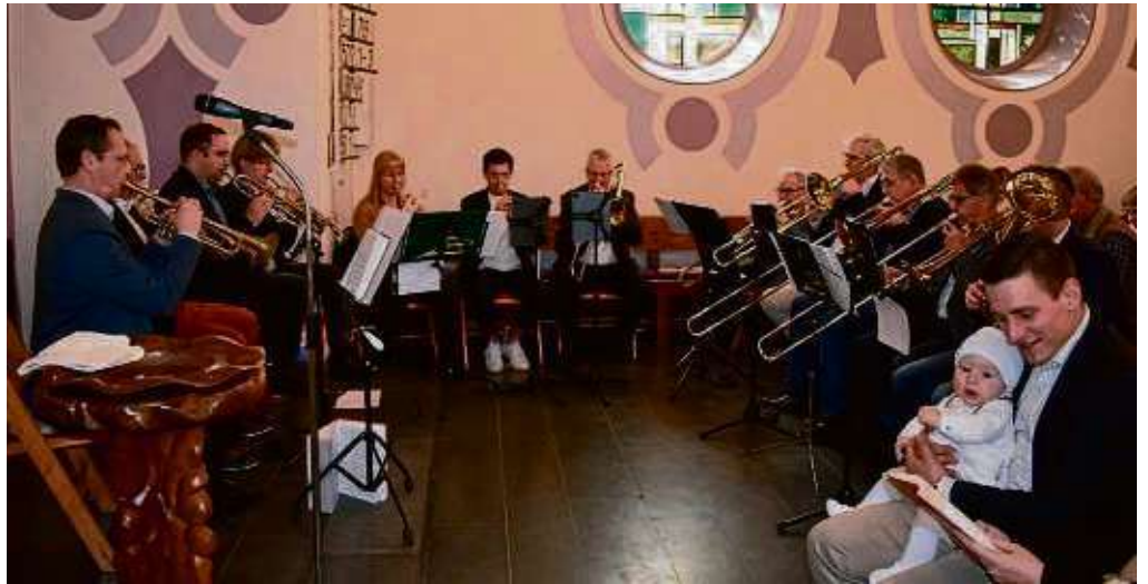
Mit Kind und Kegel kamen die Gäste zum Jubiläum des Posaunenchores.