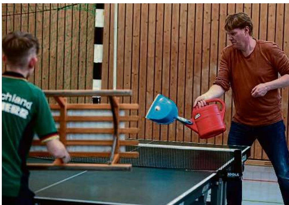
Mit kuriosen Spielgeräten warteten die Teilnehmer des Brettchenturniers der DJK auf.