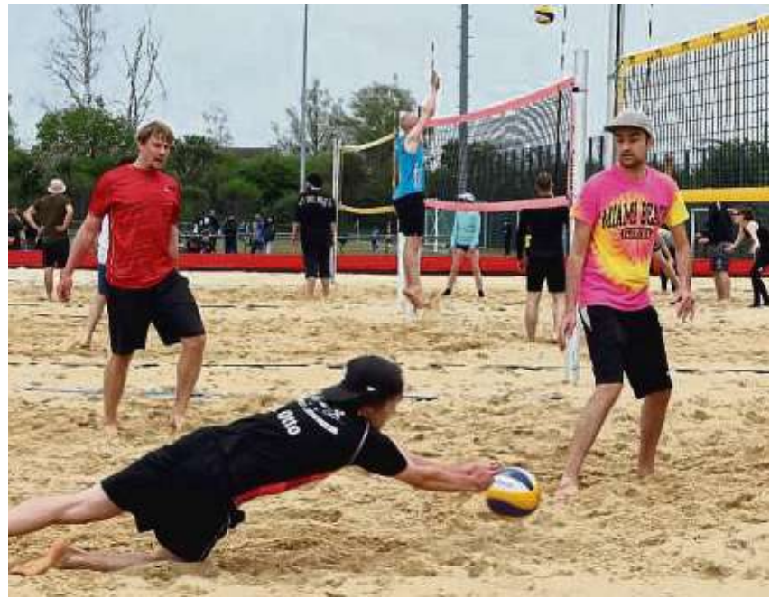
Auf der Beachvolleyball-Anlage westlich der Rodgau-Ringstraße wurde um den Ananas-Cup gespielt.