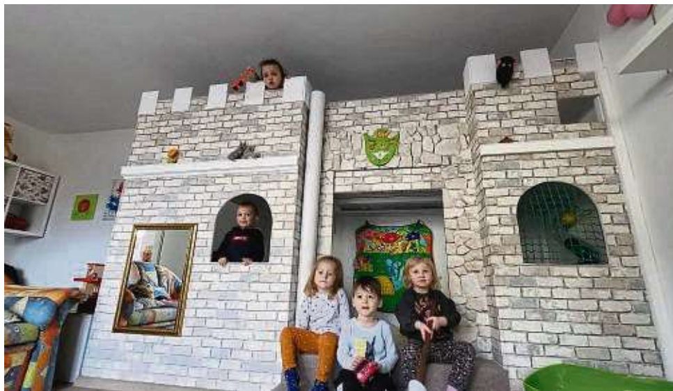
Bis zur Decke reicht das märchenhafte Spielschloss im Kinderparadies.

Der neue Entwurf (an dem die Tageseltern aber kein Mitspracherecht hatten) sieht