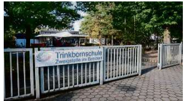
Hier soll neu gebaut werden. Der Kreisausschuss empfiehlt dem Kreistag 30,5 Millionen Euro in die Zweigstelle zu stecken.

Das geplante Raumprogramm beinhaltet eine Hauptnutzfläche von etwa 3100 Quadratmetern inklusive Sporthalle. Es entstehen insgesamt 6139 Quadratme-