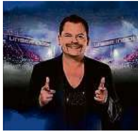
Ingo Appelt präsentiert mit „Der Staats-Trainer“ sein neues Programm am 20. Mai in Seligenstadt.

Region – Wenn er kommt, haben die Nörgler Sende-pause. Ingo Appelt hat ein Geheimrezept gegen die deutsche Depression gefunden: Es gibt so lange auf die Zwölf, bis die Sonne wieder scheint. Schmerzen werden weggelacht. Schon ein einziger Besuch seines neuen Programms „Der Staats-trainer!“ ersetzt mehrere Jahre Therapie - und zwar für Männer wie für Frauen! Denn Ingo Appelt gibt der allgemeinen Miesepetrig-keit den Rest - zur Not mit einem gezielten Tritt in den Allerwertesten. Es kann so einfach sein. Unser Ingo ist nicht mehr nur der Ingo für Männer- und Frauenthemem, nein: Er ist der Ingo für Deutsch-land! Ein Volks-Ingo. Ein Ingo für alle - alle Überforder-ten und Unterbezahlten, alle Angestregten und Aus-beuteten. Für alle, die ohne Videotutorial nicht mal mehr eine Dose vorgekoch-te Nudeln aufkriegen, keine gerade Tapetenbahn an die Wand geklebt bekommen und deren Hunde zuhause längst das Kommando über-nommen haben. Als „Bun-desarschtreter“ will Ingo Appelt mit seinem neuen Programm aufrichten und trösten - wenn es sein muss eben mit Wahrheit und