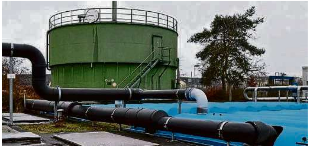
In die Jahre gekommen: Das Pumpwerk der Kläranlage muss überholt werden. Die Stadt bezuschusst die Maßnahme mit 500.000 Euro aus dem Anlagefonds.

plan und damit das Nebeneinander von Betriebswohnungen und Gewerbe an der nördlichen Philipp-Reis-Straße bleiben bestehen. Das haben die Stadtverordneten am Freitag beschlossen. Die Fraktionen machten mittels eines gemeinsamen Änderungsantrags eine Entscheidung des Parlaments aus dem Jahr 2016 rückgängig. Damals hatte es die Verwaltung beauftragt zu prüfen, inwiefern sich ein neuer Bebauungsplan für die Straße aufstellen lässt. Nach Abschluss der Prüfungen hatten die städtischen Mitarbeiter empfohlen, aus