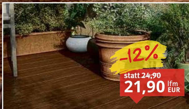
WPC Terrassendiele Symmetry Warm Sienna Massivprofil, glatt/matt mit Struktur, Montage Cobra Clip, Maße: 13,6 x 366 cm, Stärke: 2,4 cm