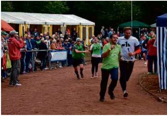
Volles Haus beim 24-Stunden-Lauf (hier ein Foto aus dem Jahr 2019). Auf eine solche Kulisse hofft der Veranstalter auch im kommenden September wieder.