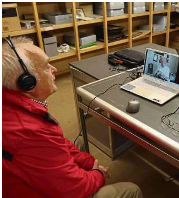
Die Zeitzeugeninterviews stießen auf reges Interesse.