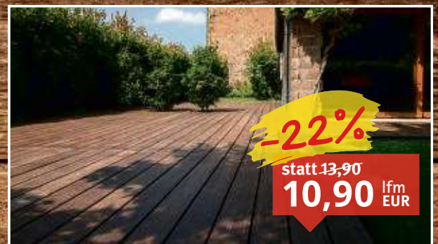
Terrassendiele Thermo-Bambus Xtreme glatt / grob geriffelt, thermobehandelt, Clipmontage Maße: 13,7 x 185 cm, Stärke: 1,8 cm