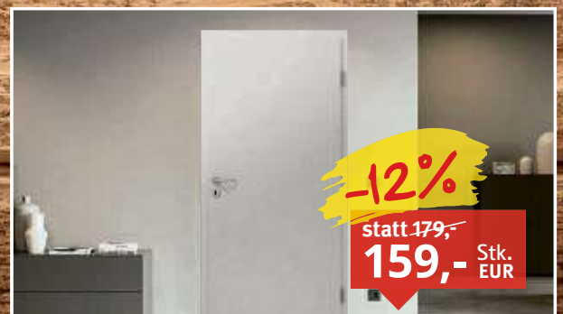
Huga Türblatt Durat Weißlack RAL 9016 Rundkante, Röhrenspanplatte, Maße: 1.985 x 735 mm