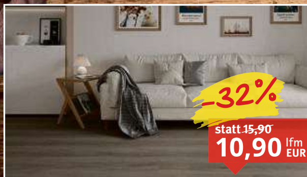
Vinylboden Eiche Lucca Landhausdiele feuchtraumgeeignet, Maße: 18 x 122 cm, Stärke: 4,5 mm