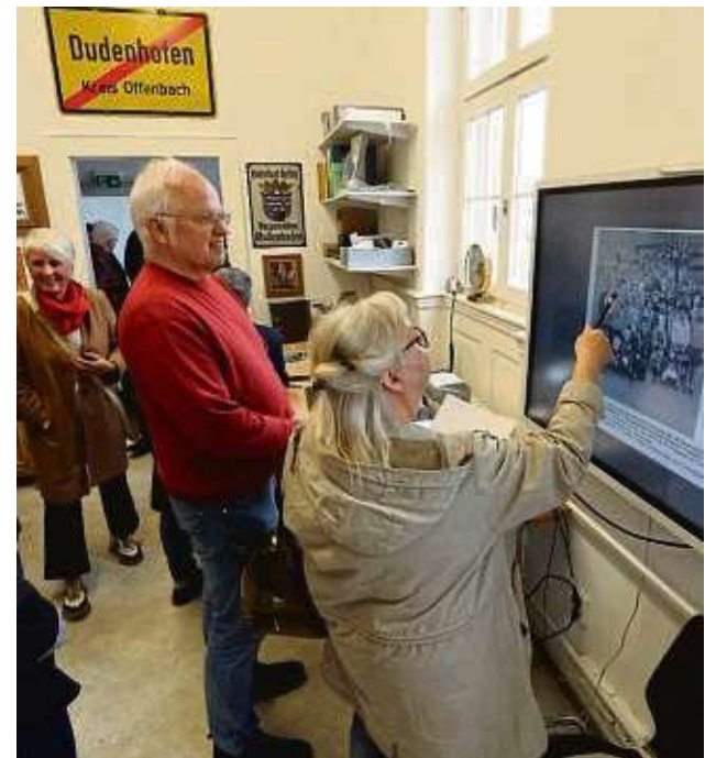
Bekannte Gesichter entdeckten viele Besucher auf den Jahrgangsbildern.