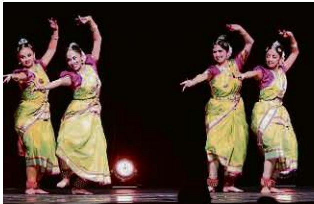
Indien im Bürgerhaus Sprendlingen: Beim Indradhanush-Festival traten viele Tanz-, Musik- und Gesangsgruppen auf.

Dreieich – Die Indische Gemeinschaft im Rhein-Main-Gebiet hat ihr „Indradhanush“ im Sprendlinger Bürgerhaus gefeiert. Etwa 700 Menschen sahen im Saal vier Stunden indisches Kulturprogramm und erlebten dabei Musik, Tänze und Auftritte von Sängern.