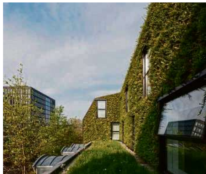
Begrünte Wände halten das Innere von Gebäuden kühl.