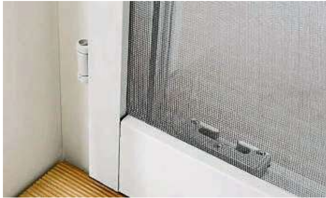
Wohnt man an einer stark befahrenen Straße, sind Feinstaubfilter sinnvoll.

Bei den tiefen Atemzügen im Tiefschlaf atmet man die schädlichen Kleinteile intensiv ein und wundert sich am nächsten Morgen über eine verstopfte Nase und Husten. Wer darauf besonders empfindlich reagiert, sollte einen Feinstaubfilter vor dem Schlafzimmerfenster anbringen. Außerdem ist bekannt, dass Feinstaub Schlaganfälle begünstigt und Herzprobleme auslöst. Mit einem Filter verbessert somit jeder die Gesundheit. Bei den Produkten haben sich einige Veränderungen zum Besseren getan. Anstatt undurchsichtiger Pol-