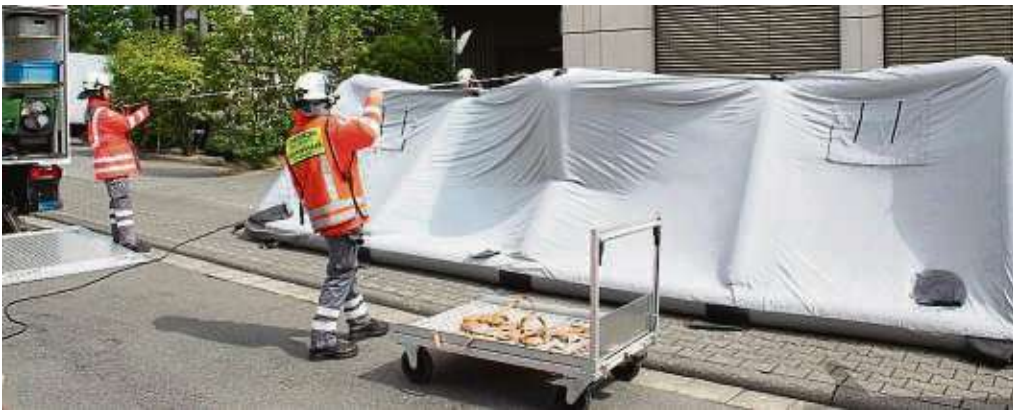
Bei einer Einsatzübung demonstrierten die Mitglieder den Aufbau eines selbstaufblasenden Verbandszeltes.