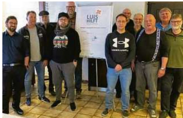
Haben große Ziele: Die Gründungsmitglieder des Vereins „Luis hilft“ wollen eine offene Begegnungsstätte für Menschen mit psychischen Erkrankungen schaffen.