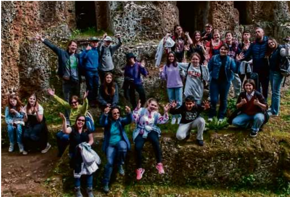
So macht Schule Spaß: Nach zwei Jahren lebt die Städtepartnerschaft zwischen Heusenstamm und Ladispoli wieder auf.