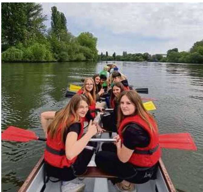
Langsames Herantasten: Nach einer Einweisung durften die „Schnupperer“ sich an den Paddeln versuchen.