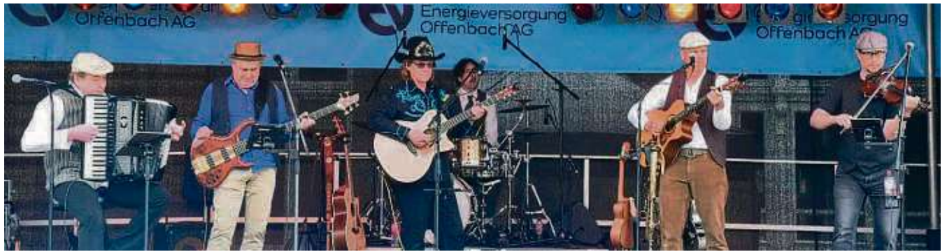
Mini-Dampflokomotive und ein buntes Musikprogramm sorgen für Unterhaltung auf dem Bahnhofsfest.

Die Reservisten der Bundeswehr verwöhnen die Gaumen der Anwesenden dazu mit Spanferkelbrötchen samt Zwiebeln, Wildschweinbratwurst mit Preiselbeeren und Chili-Cheese-Rindswurst im Brötchen. Für dieses Angebot mussten sie ihre Tafeln quer bedrücken. Und nachhaltig arbeitet das Militär auch, fünf Euro Pfand müssen Leckermäuler pro Pommes-Schale samt passenden Pieker berappen, damit die Gabelchen nach dem Verzehr wieder in der Küche der Soldaten landen. Die Kundinnen und Kun-