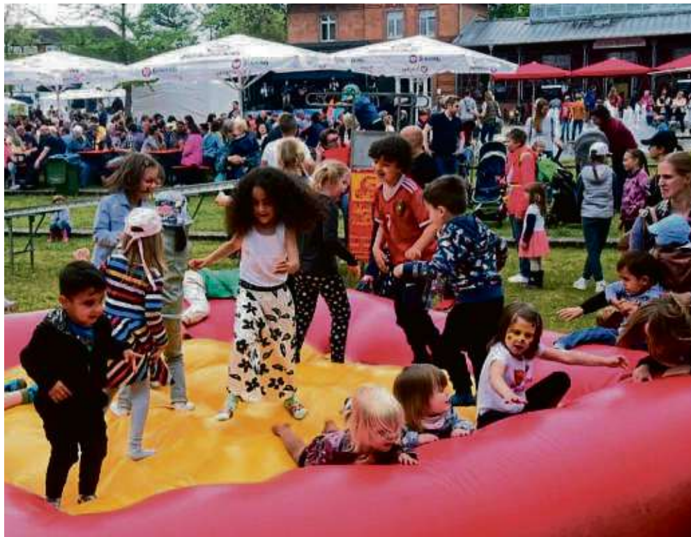
Das Hüpfkissen sorgt für Unterhaltung bei den jüngsten Besuchern.

Manche Besucher des beliebten Treffpunkts an der S-Bahn-Station kommen nicht sehr viel weiter. Denn gleich gegenüber des Postautos wartet der Freundeskreis Partnerstädte mit seinem Weinstand und lädt eingefleischte Heusenstammerinnen und Heusenstammer zum Plausch ein. Die Karte ist wie gewohnt gut sortiert, die Stand-