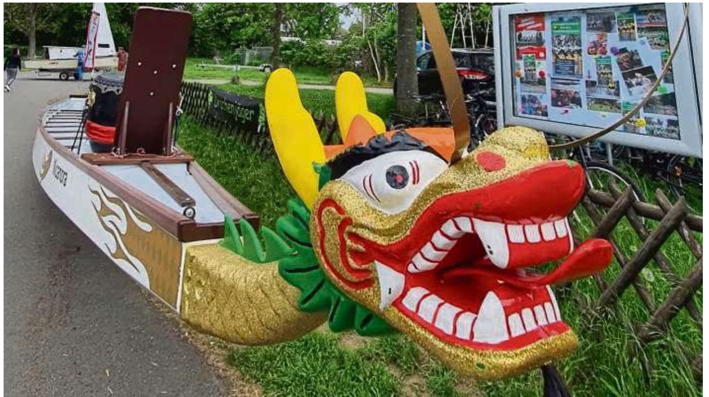
Prachtvoll verziert: So sehen die Drachenboote aus, mit denen die Sportler auf dem Main fahren.