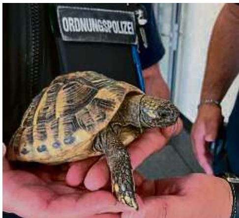
Tierischer Einsatz für die Isenburger Ordnungspolizei.

„Auch dies gehört zu dem Aufgabengebiet des Ordnungsamts“, hebt der Magistrat hervor. Die Katzen wurde „im Rahmen einer polizeilichen Maßnahme sichergestellt“ und zunächst