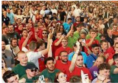
Volles Zelt: Beim Bieranstich gab's kaum ein Durchkommen.