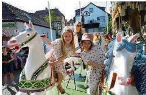
Die Hayner Reitschul' ist ein magischer Anziehungspunkt für (junge) Kerbbesucher.