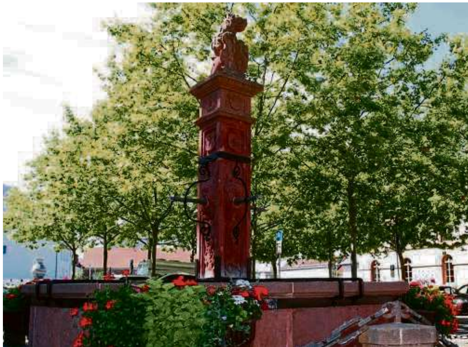
470 Jahre alt und aus der Altstadt nicht wegzudenken ist der Vierröhrenbrunnen. In diesem Jahr müssen sich die Bürger aber noch etwas gedulden, bis Wasser aus den vier Röhren plätschert.

„Die erforderlichen Arbeiten einschließlich der Trocknungszeit für die bearbeiteten Stellen nehmen etwa zwei Wochen in Anspruch“, heißt es aus dem Rathaus. Da das Ebbelwoifest aber schon