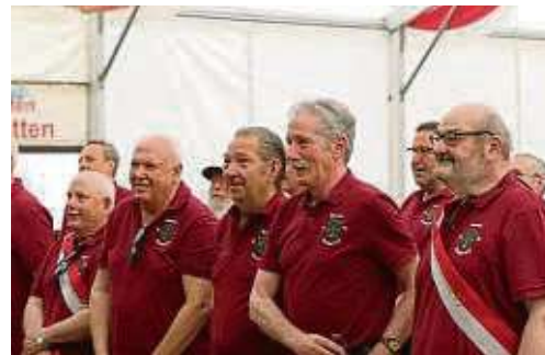
Auch die Jubiläums-Kerbborsche von 1973 hatten ihre Freude am Kerbgottesdienst.