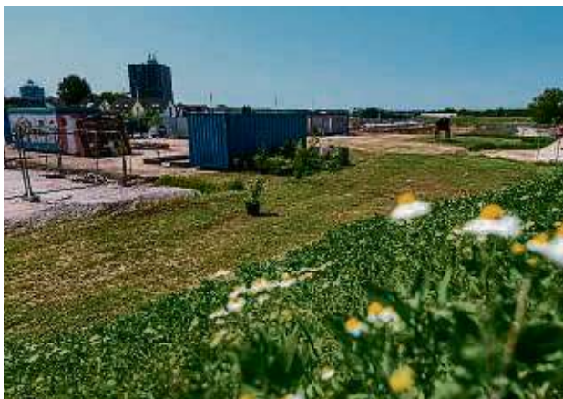
Angekommen: Die Juki-Farm ist nun auf einem Grundstück an der Alten Römerstraße zu finden.

von Bonava und zwei weiteren Firmen“, sagt Joachim Hergenröther. Die schweren Arbeiten, der Umzug der Container, sind erledigt. Auch der große Traum von Hergenröther, den Kindern einen Hügel mit Tunnel auf dem Spielgelände zu bieten, hat sich endlich verwirklicht. Der blaue Wasseranschluss ragt schon aus der noch trockenen Erde – es wird nicht mehr lange dauern und die Kinder können auf dem geplanten Wasserspielplatz umhertollen. Die Wiedereröffnung der Juki-Farm ist für 17. Juni mit einem Fest geplant – wenn bis dahin die Stromleitungen alle funktionieren. Ansonsten muss das Fest noch eine Woche nach hinten verschoben werden. Der offene Betrieb startet am Montag nach der Eröffnungsparty, dann wieder wie gewohnt von Montag bis Samstag von 15 bis 18 Uhr mit der Unterstützung von einem Team aus Honorarkräften. Die Vermietung des Platzes beginnt im Juli. „Wir sind schon stark gebucht bis zum Oktober mit Kinderg Geburtstagen und Klassenfes-