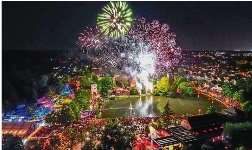
Alles so schön bunt hier: Dreieichs Stadtfotograf Michael Häfner hat diese Aufnahme vom Feuerwerk am Kerbsamstag gemacht und noch ein bisschen nachbearbeitet. Tausende Menschen verfolgten das Spektakel.

Der Kerbgottesdienst, seit dem 300. Geburtstag der Burgkirche im Festzelt, hat inzwi-