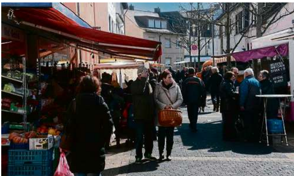
„Zukunft Innenstadt“: Mit Mitteln aus dem Landesförderprogramm soll die Bahnhofstraße aufgehübscht werden.