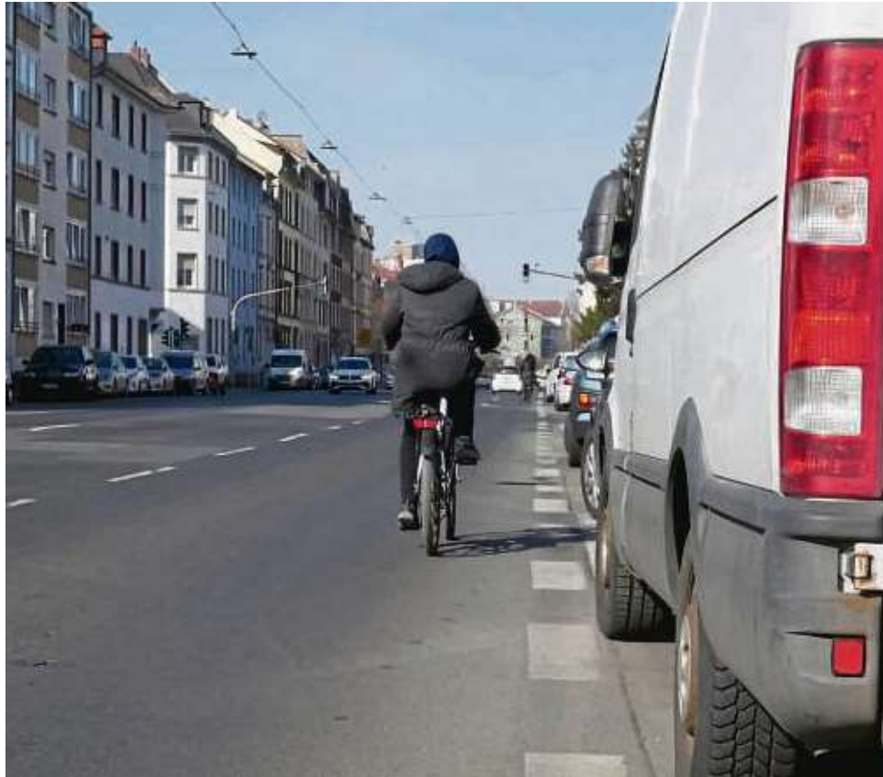
Aus vier mach zwei: Zwischen Bahnüberführung und Hessenring werden jeweils die äußeren Fahrspuren zu Radfahrstreifen auf Probe umgewandelt. Busse dürfen die Radspuren aber nutzen.

Aus der Verkehrskommission, wie das Begleitgremium zur Umsetzung des Radentscheids (mit Vertretern der Fraktionen, IHK, Handwerk, ADFC oder ADAC) heißt,