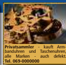
Privatsammler kauft Arm- banduhren und Taschenuhren, alle Marken, auch defect. Tel. 069-0000000