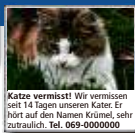
Katze vermisst! Wir vermessen seit 14 Tagen unseren Kater. Er hört auf den Namen Krumel, sehr zutraulich. Tel. 069-0000000

für nur 5,00 € Aufschlag Fließsatsanzeige mit Bild im Tiermarkt und An- und Verkauf