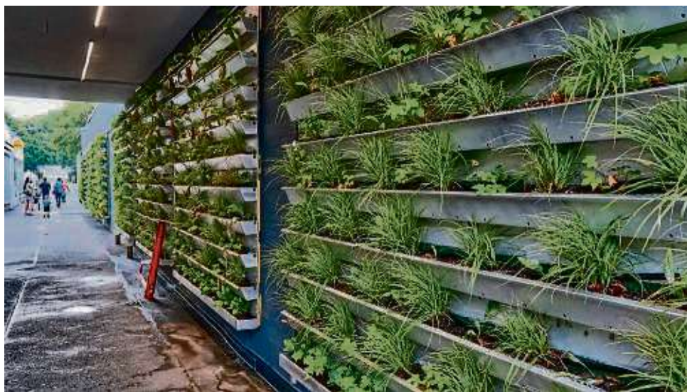
Die umgestaltete Passage mit der vertikalen Pflanzwand mit automatisierter Bewässerung.

Ist dieser Hinweis wirklich nötig? „Leider ja“, antwortet Bürgermeister Gene Hagelstein. „Als die Blümchen eingesetzt wurden, haben wir schnell feststellen müssen, dass die ein oder anderen in Privatbesitz übergegangen sind, das ist natürlich nicht Sinn der Sache.“ Eine Anliegerin formuliert es deutlicher: Kaum seien die Blumen gepflanzt gewesen, da war die erste Reihe auch schon fast komplett wieder weg. Manch einer habe gedacht, es sei eine PR-Aktion von Rewe. „Wir bitten noch einmal eindringlich darum,