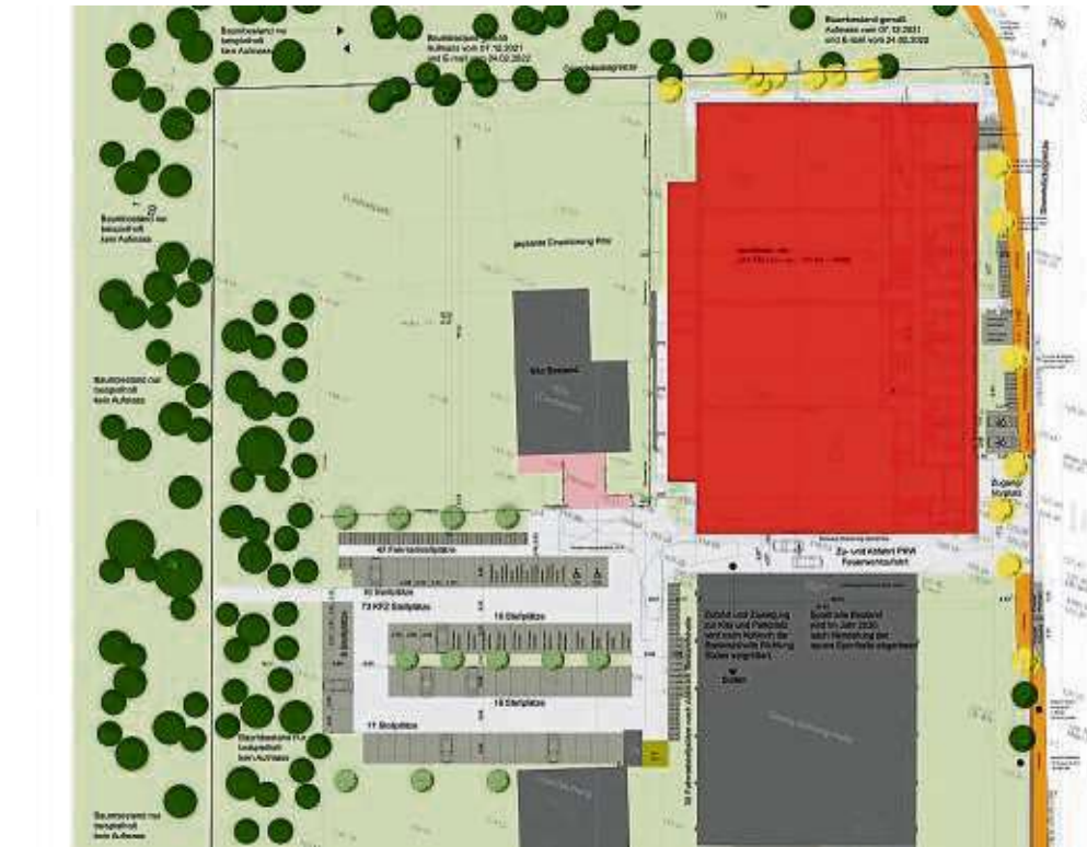
Zusätzliche Kapazitäten für Schul-, Breiten- und Leistungssport: Die neue Halle (rot) wird nördlich der Georg-Sehring-Halle errichtet. Unten links ist der neue Parkplatz zu sehen.