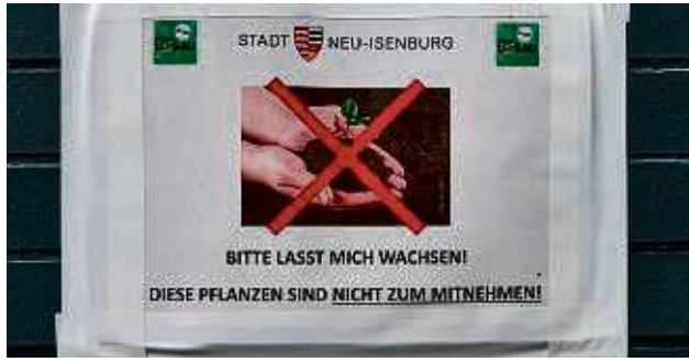
Leider offenbar nötig: Hinweisschilder erklären, dass hier keine Selbstbedienung bei den Pflanzen gilt. F. POSTL

Die Anlage wird per Computer bewässert und automatisch gesteuert. Die Montage ging Ende Juli über die Bühne. Dabei wurden auch der Wandanschluss entlang des Rewe-Markts sowie die Decke im