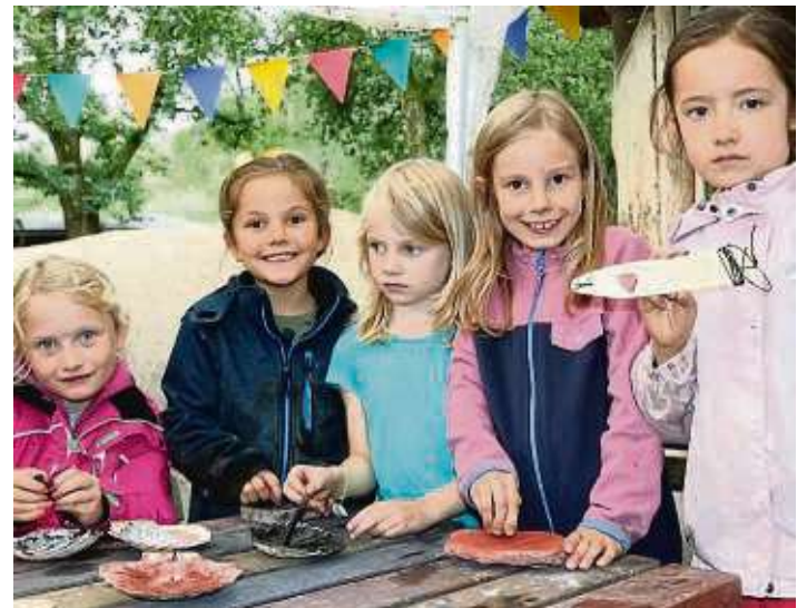
Auf den Spuren der Vergangenheit: Die Ferienspielkinder basteln diese Woche Steinzeit-Werkzeuge.

In den letzten beiden Ferienwochen bieten die Dreieichhörnchen offenen Betrieb, von Mittwoch bis Samstag können alle zwischen 14 Uhr und 17.30 Uhr zum Spielen kommen.