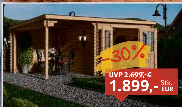
Gartenhaus Blockbohlenhaus CA2976 28 mm naturbelassen Fichte unbehandelt, B x T x H: 496 x 309 x 204 cm, Sockelmaß Haus: B x T: 280 x 280 cm, inkl. 200 cm Anbau