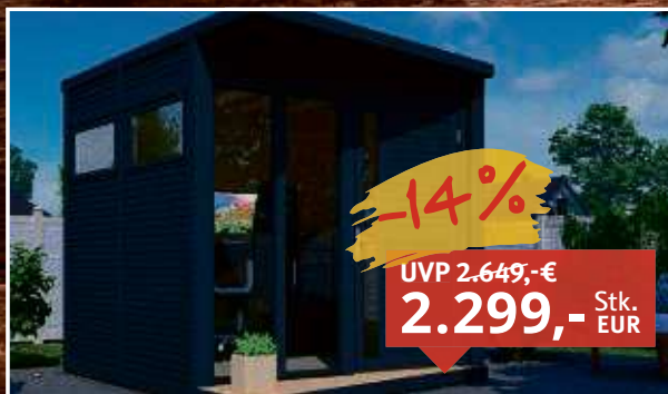
Gartenhaus Futura Premium 19 mm anthrazit Fichte, lackiert/lasiert, B x T x H: 234 x 303 x 227 cm, Sockelmaß Haus: 234 x 225 cm, inkl. Boden + Dachpappe zur Ersteindeckung