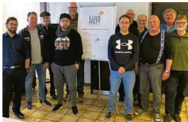
Haben große Ziele: Die Gründungsmitglieder des Vereins „Luis hilft“ wollen eine offene Begegnungsstätte für Menschen mit psychischen Erkrankungen schaffen.