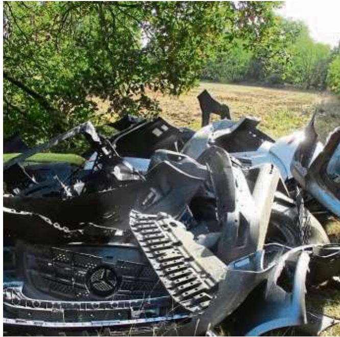
Ein Autowrack im Feld an der Dietesheimer Straße

Das Ordnungsamt ist zentrale Anlaufstelle in Sachen Sauberkeit. Meldungen zu Abfällen auf öffentlichen Flächen, falsch gefüllte oder abgestellte Behälter, Sauberkeit der Glas- und Kleidercontainerstandorte oder Schädlinge kommen da zusammen. Abteilung 3 beschäftigt sich mit der Ermittlung und schaut regelmäßig selbst nach illegalen Abfällen. Mitarbeiter prü-