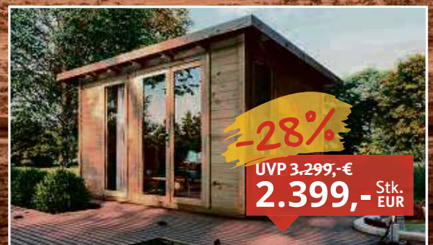
Gartenhaus Homeoffice Karvo 2 28 mm naturbelassen Fichte unbehandelt, B x T x H: 405,8 x 304,8 x 228,7 cm, inkl. Glanzglastür, inkl. 2 Fenster