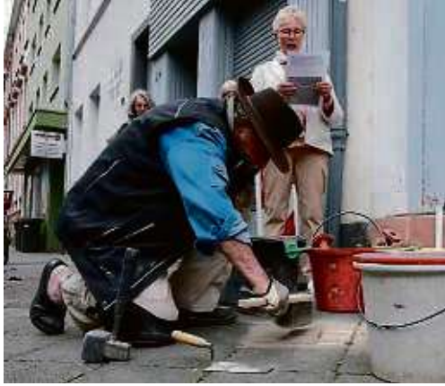
Verlegung neuer Stolpersteine: Gunter Demnig putzt das Mahnmal der Familien Simon und Berg in der Bahnhofstraße.

Damit die so bedachten Opfer auch tatsächlich im leben-