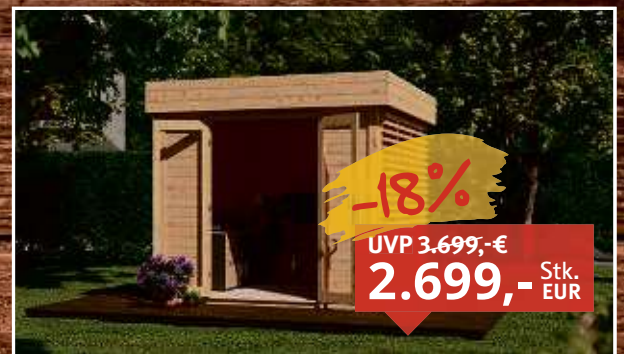
Gartenhaus Homeoffice Ivar 28 mm naturbelassen Fichte naturbelassen, B x T x H: 277,6 x 283,5 x 248 cm, inkl. große Fensterfront