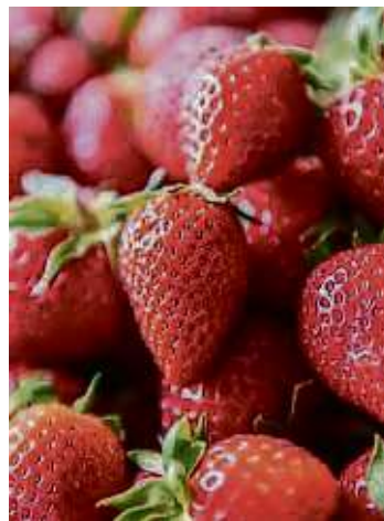
Auf er Burg dreht sich am Sonntag alles um die Erdbeere.

Um die Kinder kümmert sich das Team der „Jungen Burg“ mit Märchenlesung sowie ihren beliebten Spielen und die Kronberger Ritter.