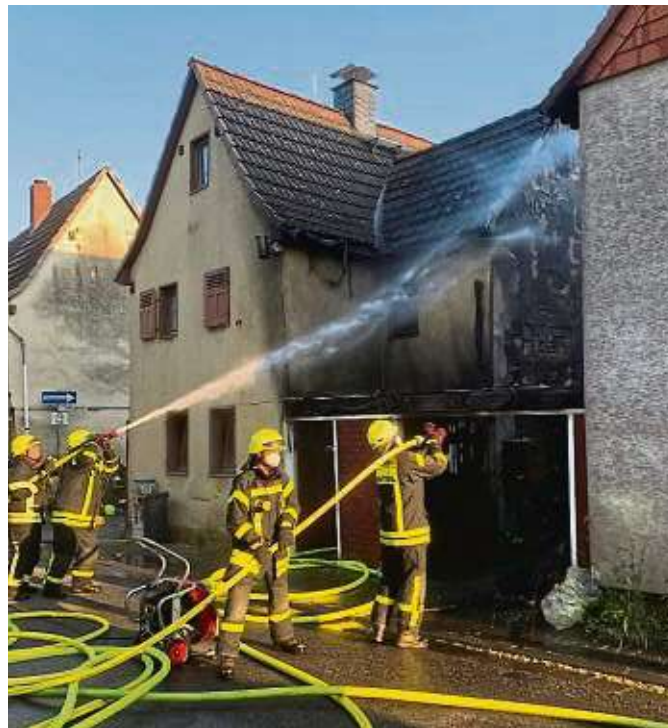
Das unsachgemäße Betreiben eines Holzgrills mit Brandbeschleuniger sorgte in der Goethestraße 8 in Kriftel für einen enormen Schaden.

„Die Feuerwehr konnte den Gebäudebrand vollständig löschen. Durch die hohe Hitzentfaltung wurden jedoch die angrenzenden Wohnhäuser beschädigt“, so Jirasek, der am