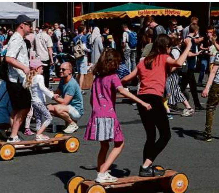
g der offenen Tür des Notfallzentrums die Mischung aus Information und Un