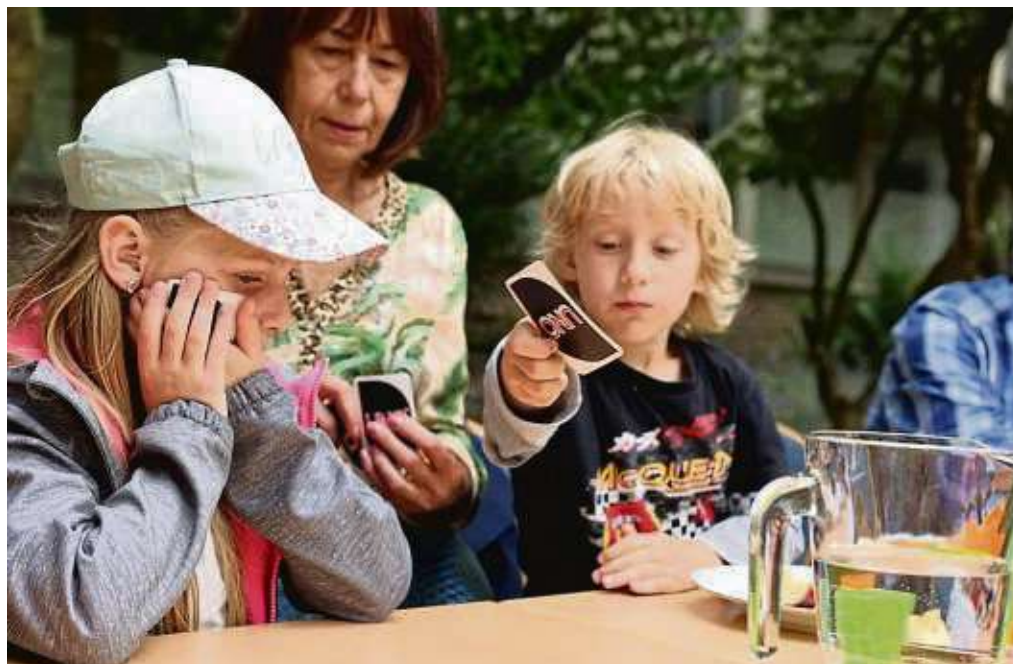
Das Café Herzenswärme ist als offenes Angebot jeden Mittwoch von 14 bis 17 Uhr geöffnet.

KRIFTEL (red) – „Wann müssen Rentner wie viel Steuern zahlen?“ Zu diesem Thema veranstaltet das Familienzentrum einen Themenabend am Dienstag, 20. Juni, 19 Uhr, im Rat- und Bürgerhaus. Der Besuch der Veranstaltung ist kostenlos. Infos bei Gabriele Kortenbusch unter ☎ 06192 4004-26 oder per E-Mail an gabriele.kortenbusch@kriftel.de.