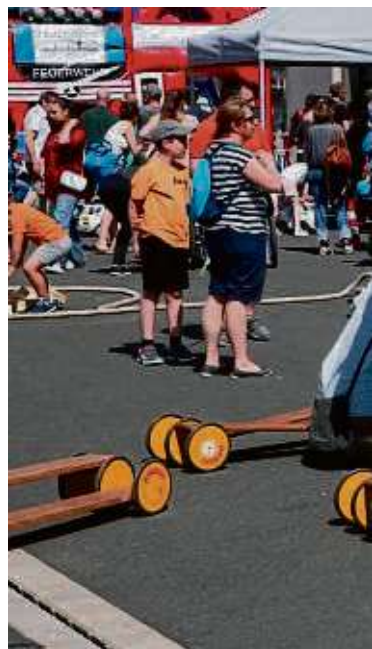
Rund 3.000 Besucher genossen beim Tag der offenen Tür

So wurde die Fahrzeughalle der Feuerwehr leerräumt und mit Tischen und Bänken bestückt, so dass das kulinarische Angebot – Bratwurst und Steak vom Grill, Chicken Nuggets und Pommes sowie Kuchen und natürlich Getränke – bequem im Sitzen genossen werden konnte. Beim ASB lag der Fokus auf Spiel und Spaß für die Kinder. Hier wurde also geschminkt, gebastelt und gemalt, außerdem gab es Hüpfbälle und Stelzen, und bei einer Tombola konnte einiges gewonnen werden. Auf dem Hof warteten zwei Hüpfburgen und unter anderem ein überdimensionales Jenga-Spiel. Neben einem von insgesamt 22 „Wünschewagen“ deutschlandweit präsentierte der ASB auch zwei Kameradrohnen, die in erster Linie für die Personensuche oder zur Lageerkundung eingesetzt werden. Diese sind zwar im Rheingau-Taunus-Kreis stationiert, können aber auch vom Main-Taunus-Kreis angefordert werden. Shaikh ließ sich die Technik näher erläutern und erfuhr, dass eine solche Drohne