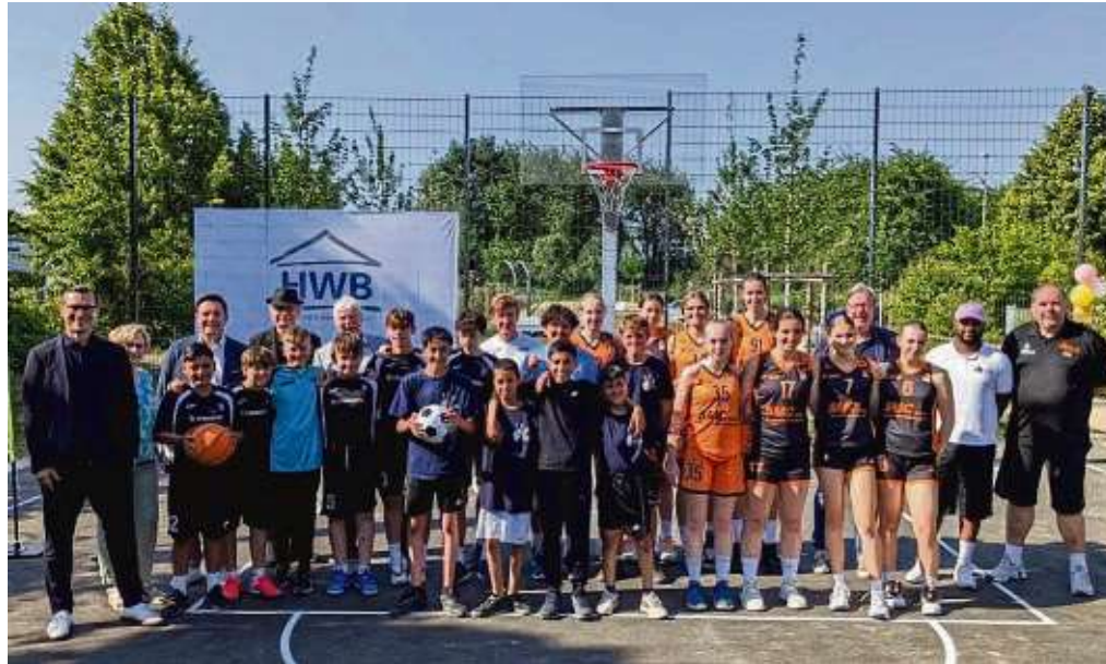
Gruppenbild zur Einweihung der neuen Anlage mit den frischgebackenen Deutschen U18-Basketballmeisterinnen des TV Hofheim, den Fußballern vom SV 09 Hofheim und dem Haus der Jugend und Vertretern der HWB und der Stadt Hofheim.

SCHWALBACH (red) – Auch in diesem Jahr wird von Stadt und Kulturkreis GmbH die lockere Veranstaltungsreihe „Tanz auf dem Marktplatz“ angeboten. Mit Salsa ging es am vergangenen Donnerstag los. Am 15. Juni steht Foxtrott auf dem Programm, am 22. Juni beide Walzer. Weiter geht es am 29. Juni mit Bachata und am 6. Juli bildet Discofox den Schluss. Wer gerne tanzt, sollte um 19 Uhr einfach vorbeikommen. Jeder „Tanz auf dem Marktplatz“ beginnt mit 45 Minuten Line Dance.