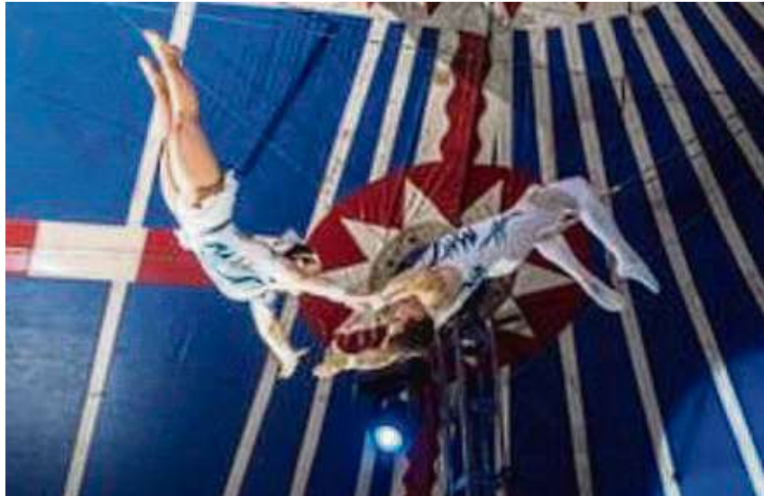
Atemberaubende Artistik gibt es im Circus Gebrüder Barelli zu sehen.

nur im traditionellen Zelt und den mehr als 100 Jahre alten Zirkuswagen zeigt, sondern auch in einem eigenen rollenden Zirkusmuseum mit historischen Exponaten wie Drehorgeln und alten Uniformen. Das Museum ist während der Gastspielzeit täglich von elf bis 19 Uhr geöffnet und steht allen Interessierten zur Verfügung. Besucher haben außerdem die Möglichkeit, im historischen Café einzukehren. Ein weiteres Highlight ist der Tag der offenen Tür am Mittwoch, 1. Mai, elf bis 18 Uhr. Die Besucher können sich umschauen, den Circus Gebrüder Barelli erkunden, die alten Wagen sowie das Zirkus-Museum bestaunen. An diesem Tag gilt: Freier Eintritt für alle. Freien Eintritt erhalten auch Väter am Vater- (9. Mai) und Mütter am Muttertag (12. Mai), je in der 15-Uhr-Vorstellung – solange es