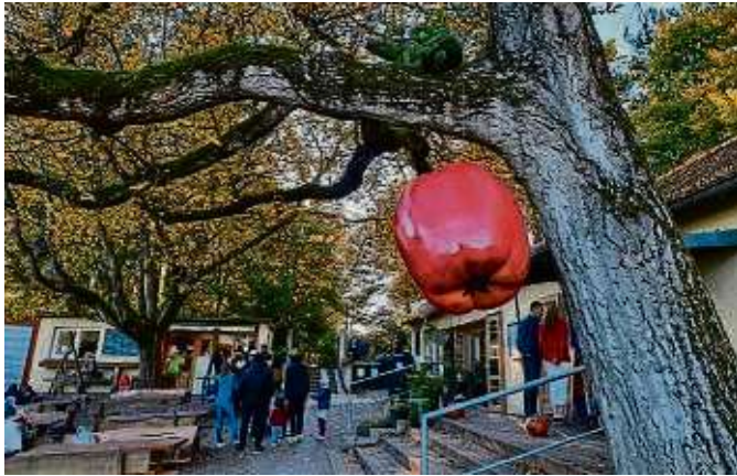
Das Main-Äppel-Haus bringt Besuchern das Biotop Streuobstwiese unter anderem beim Streuobstfest näher.

Seckbach (red) – Wenn der Frühling, wie Eduard Mörike einst schrieb, sein blaues Band wieder durch die Lüfte flattern lässt, lädt das Main-Äppel-Haus Lohrberg, Klingenbergweg 90, zu seinem zweiten Streuobstfest ein. In etwas geänderten Format zu den bisherigen Blüten- und Äppelfesten, aber mit einem nicht minder spannenden und informativen Programm stellt das Team des Streuobstzentrums am Sonntag, 28. April von zehn bis 18 Uhr seine Arbeit vor und zeigt alte Handwerks-techniken rund um die Wiese. Es wird gesenzt, gedengelt und geschmiedet. Und mit etwas Glück lassen sich die Schafe und Ziegen, die auf den Wiesen grasen, streicheln. Bei Fragen zu Garten, Naturschutz und Streuobst stehen immer kompetente Ansprechpartner zur Verfügung. Unter ihnen ein Pomologe, der Auskunft zu den verschiedenen Apfelsorten gibt und praktische Tipps für den Anbau parat hat oder der Verantwortli-