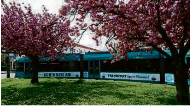
Die Wassersparkampagne ist jetzt mobil: Eine Straßenbahn mit dem Kampagnenmotiv „Ich dreh ab“.

Die Wassersparkampagne der Stadt Frankfurt geht in die dritte Runde. Neben Plakaten und Postkarten ist das Kampagnenmotiv dieses Jahr auch auf Straßenbahnen zu sehen. Seit Anfang April fahren zwei mit den Motiven der Wassersparkampagne durch das Stadtgebiet. Die Straßenbahnen sind die nächsten sechs Monate auf wechselnden Linien quer durch Frankfurt