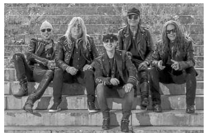
Die Scorpions beenden ihre Tour in Frankfurt.

sagt Meine. Tickets zu ab 97,60 Euro gibt's online auf myticket.de .