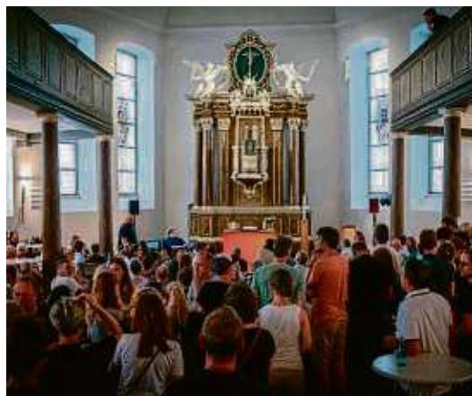
Die Plattenteller in der Johanniskirche drehen sich wieder beim Vinylgottesdienst.

Und das in der barocken Johanniskirche, die für diese Abende komplett umgestaltet wird. DJ Stelze und SK Libra kennen sich seit knapp drei Jahren und haben in der Zeit einiges erlebt und gestaltet: Auflegen in einer Kirche im Dezember bei minus fünf Grad, Listening Session für eine Straußwirtschaft unter freiem Himmel bei 33 Grad. Und dazwischen und drumherum viele Nächte im Club mit Bassmusik und Luftfeuchtigkeit um