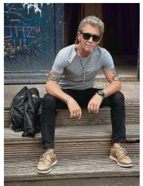
Die Rock-Legende kommt open Air nach Frankfurt: Peter Maffay.

amerikanischen Sängerin Anastacia, die mit „I'm outta Love“ im Jahr 2000 bekannt wurde. Halt macht die singende Ikone auch in Frankfurt: Am Donnerstag, 18. Juli, ab 20 Uhr im Deutsche Bank Park, Mörfelder Landstraße 362. Tickets zu ab 74,95 Euro gibt es online auf eventim.de und an den bekannten Vorverkaufsstellen.