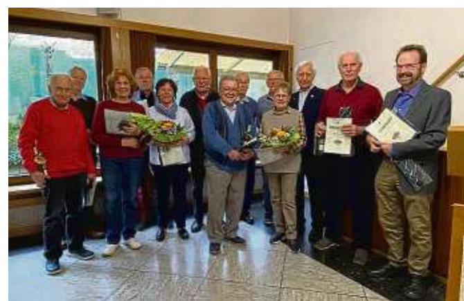
Die Jubilare beim OGV Bergen-Enkheim freuen sich über ihre Ehrungen für langjährige Mitgliedschaft.