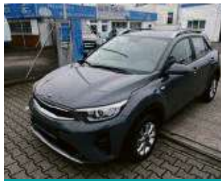
Kia Stonic.1.2i Bj. 21, Extras, 39.000 KM, 15.950 €. Autohaus Müller, Industriestr. 7, 63150 Heusenstamm, ☎ 06104-8024444