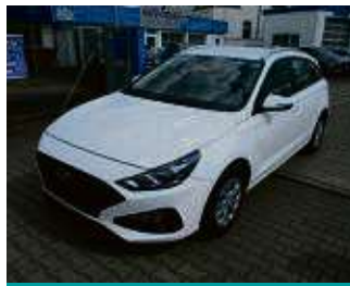
Hyundai i 30 Kombi. Bj. 21, viele Extras, 50.000 KM, 14.750 €. Autohaus Müller, Industriestr. 7, 63150 Heusenstamm, ☎ 06104-8024444