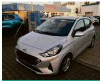
Hyundai i 10. Bj. 22, 25.000 KM, viele Extras, 12.450 €. Autohaus Müller, Industriestr. 7, 63150 Heusenstamm, ☎ 06104-8024444