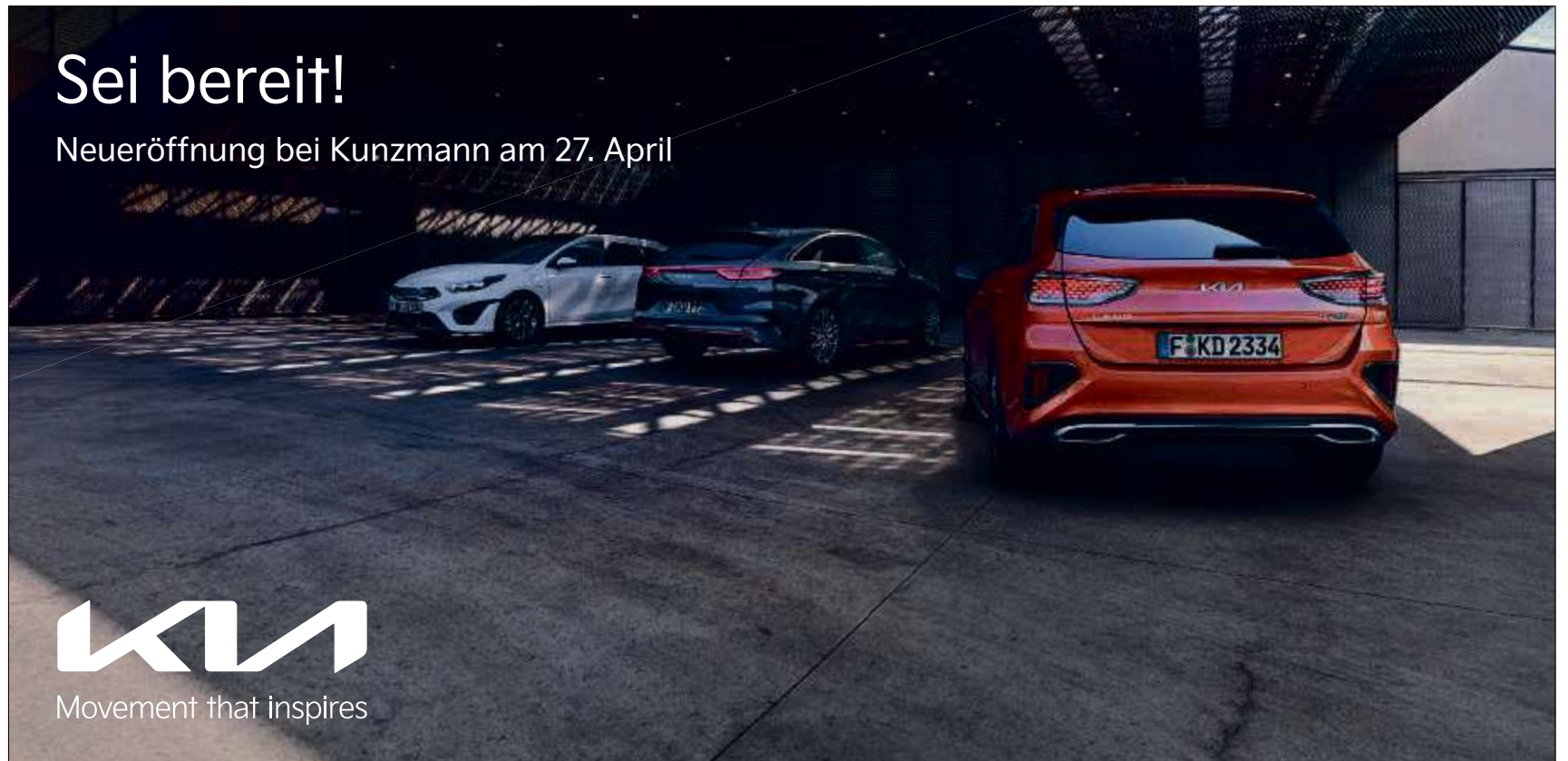
Abbildung zeigt kostenpflichtige Sonderausstattungen.

Unterliederbach (red) – Nick Mason's Saucerful of Secrets kommen nach Frankfurt: Am Donnerstag, 1. August, spielen sie in der Jahrhunderthalle, Pfaffenwiese 301. Die 2018 gegründete Band spielt das gefeierte Frühwerk von Pink Floyd, darunter Stücke aus der Ära von „The Piper at the Gates of Dawn“ von 1967. Tickets zu ab 61,50 Euro auf eventim.de .