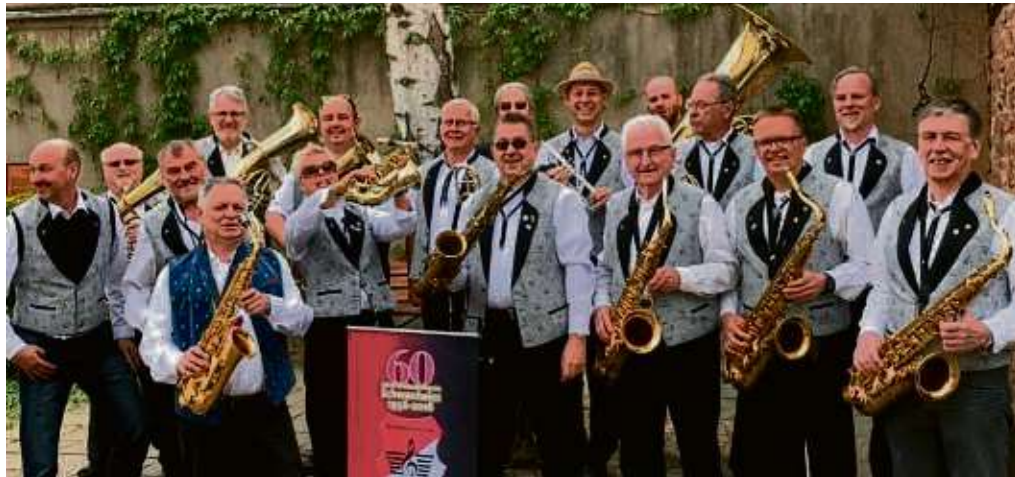
Der Orchesterverein Schwanheim freut sich schon aufs regelmäßige Musizieren.