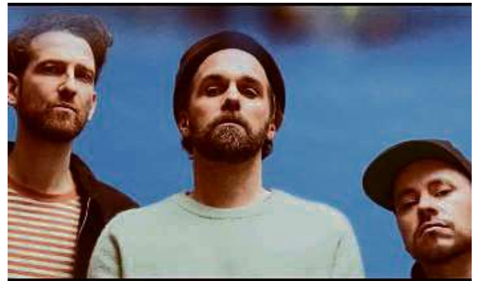
Die Jungs von OK Kid treten im Juni in Frankfurt auf.