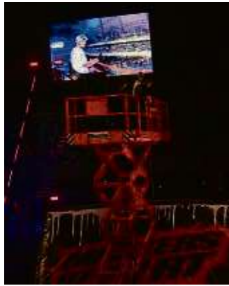
Star Fabio Wibmer macht sich auf der Hebebühne bereit zum Sprung.