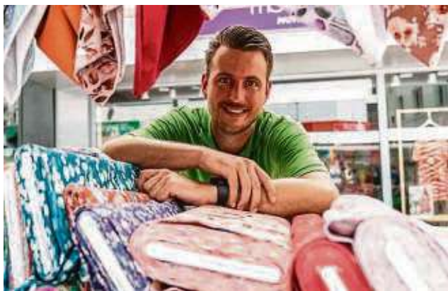
Der Deutsch-Holländische Stoffmarkt ist ein Paradies für Hobbynäher, Stricklieseln und DIY-Freunde.

Der Marktplatz wird zum Paradies für Kreative und Hobbynäher, die hier alles für ihre Projekte finden. Der Stoffmarkt ist nicht nur eine Einkaufsgelegenheit, sondern auch ein Ort des Aus-