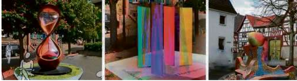
So könnte es aussehen: Das Kunstobjekt für Hochstadt soll seinen Platz an der Historischen Hauptstraße in Hochstadt finden.

Die Stadt Maintal setzt in Zusammenarbeit mit dem Stadtleitbildprojekt „Maintal kulturell“ und dem Fachdienst Kulturelle Bildung ein Konzept zur Förderung von Kunst im öffentlichen Raum um. „Dieses Konzept sieht die Installation von Kunstobjekten in allen vier Stadtteilen vor, um das städtische Erscheinungsbild zu bereichern und die Identifikation der Bürgerinnen und Bürger mit