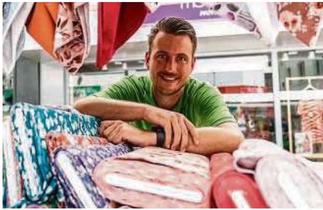
Der Deutsch-Holländische Stoffmarkt ist ein Paradies für Hobbynäher, Stricklieseln und DIY-Freunde.

Der Marktplatz wird zum Paradies für Kreative und Hobbynäher, die hier alles für ihre Projekte finden. Der Stoffmarkt ist nicht nur eine Einkaufsgelegenheit, sondern auch ein Ort des Aus-