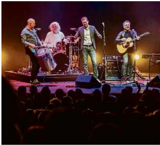
Die schönsten Songs des Kultduos Simon & Garfunkel sind am 20. April in der Klosterberghalle zu hören.