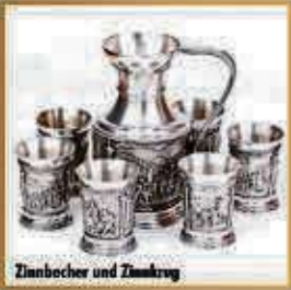
Zinnbecher und Zinnkrug