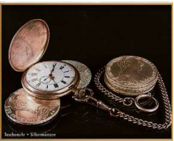
Faschuhre • Silbermünzen

aus dem Tresor zu holen und diese den Experten vorzulegen. Laut Experten kann beispielsweise eine Rolex GMT Master aus den 70er Jahren bis zu 9.000 EUR erzielen. Des Weiteren bieten die Experten von »Bares für Wa(h)res« kostenlose Wertschätzung von Diamanten an. Besonders interessant sind Diamanten im Brillantschliff ab einer Größe von 0,50 Carat. Hier gilt immer die Faustregel: ein einzelner großer Diamant ist wertvoller als viele kleine Diamanten. Ein Besuch bei den Experten lohnt sich in jedem Fall, denn hier wird Ihr Schatz professionell taxiert und zu einem fairen Preis entgegengenommen.