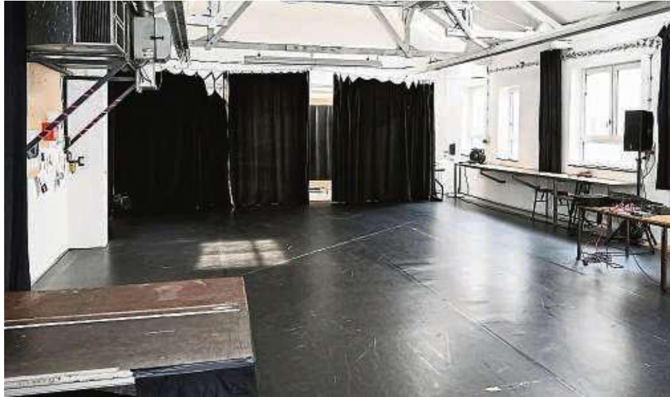
Blick in einen der drei neuen Probenräume, der mit einem Tanzboden ausgestattet wurde.