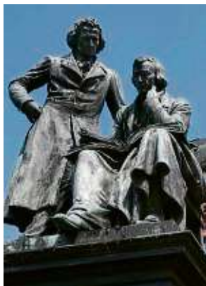
Hanau hat seinen berühmtesten Söhnen ein Denkmal gesetzt.

nicht nur für Kinder gedacht, sondern entstanden vor allem aus volkscundlichem Interesse. dpa/cs.