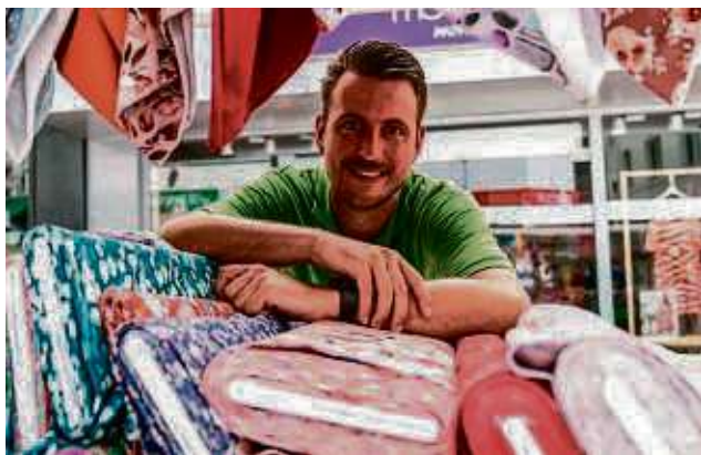
Der Deutsch-Holländische Stoffmarkt ist ein Paradies für Hobbynäher, Stricklieseln und DIY-Freunde.

Der Marktplatz wird zum Paradies für Kreative und Hobbynäher, die hier alles für ihre Projekte finden. Der Stoffmarkt ist nicht nur eine Einkaufsgelegenheit, sondern auch ein Ort des Aus-