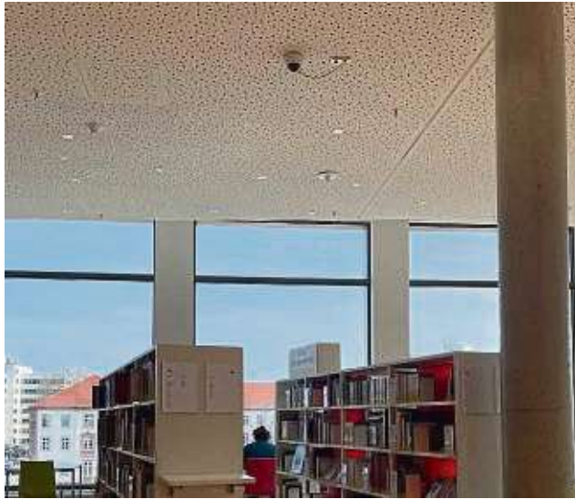
Eine der vier Kameras, die jetzt im Kulturforum an der Decke hängen.

In den vergangenen Monaten seien unterschiedliche Formen der Sachbeschädigung festgestellt worden, heißt es auf Nachfrage unserer Zeitung. Vorfälle aus dem vergangenen Jahr sind laut Stadt aufgeschlitzte Polster an den Sitzgelegenheiten, das Beschmieren von Wänden,