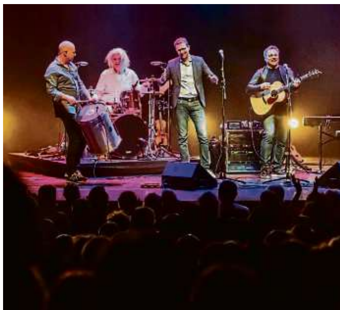
Die schönsten Songs des Kultduos Simon & Garfunkel sind am 20. April in der Klosterberghalle zu hören.