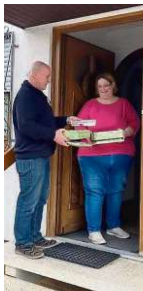
Es gibt wieder „Essen auf Rädern“, da sich drei neue Anbieter gemeldet haben. Darüber freut sich auch diese Betreuerin einer Seniorin, die das Essen für sie entgegennimmt.

zeit sei vor allem für Seniorinnen und Senioren wichtig, um deren Gesundheit und Lebensqualität zu erhalten, heißt es weiter in Stuttmanns Mitteilung. „Eine warme Mahlzeit kann den Appetit anregen und das Essen angenehmer machen. Auch eine ausgewogene und abwechslungsreiche Ernährung wird durch die Essenslieferung leichter. Diese ist wichtig für die Erhaltung von Muskelmasse und Gewicht“, informiert die städtische Seniorenberatung. Dass nach der Einstellung der Lieferungen durch den bisherigen Anbieter weiterhin Bedarf dafür bestehe, konnte Stuttmann den zahlreichen Rückmeldungen von Senioren und vor allem von deren besorgten Familienangehörigen entnehmen.