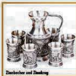
Zinnbecher und Zinnkrug