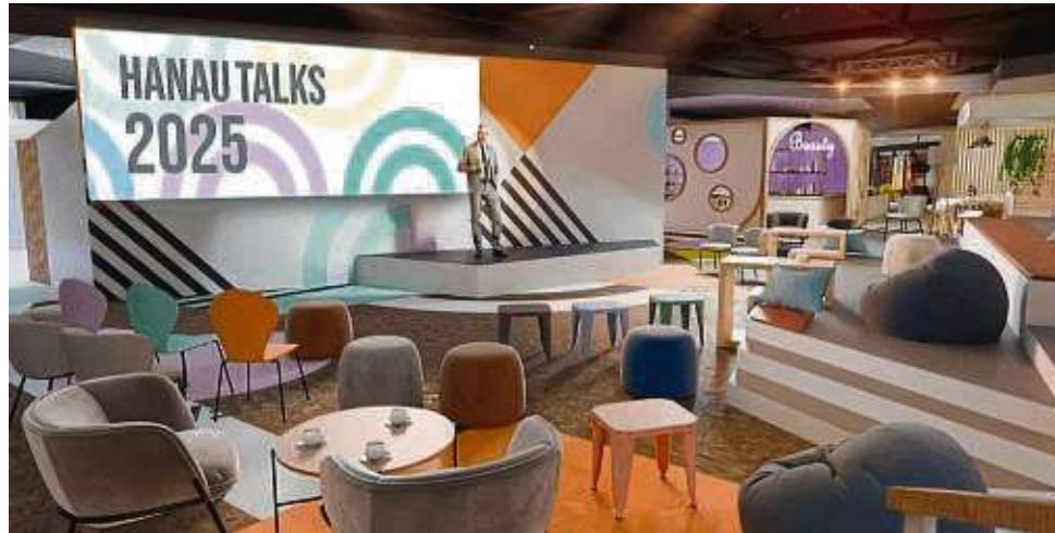
Eine Agora, quasi ein multifunktionaler Marktplatz, soll das Herzstück im Parterre werden. Geplante Eröffnung: im kommenden Herbst.

Das Karbener Unternehmen Satis&fy hat das Design fürs Erdgeschoss und die Ladenflächen konzipiert, rund 20 sogenannte Shop-Schollen von 16 bis 106 Quadratmetern Größe. Vielfalt ist angesagt: Da gibt es in der Computeranimation der künftigen Etage beispielsweise eine Einheit im Holzdesign, um die Ecke tut sich ein lang gestrecktes Ladenlokal mit pastellfarbenen Streben auf, daneben eine Art Kiosk im Vintage-Look und ein Shop mit großem Rollladen. „Hinter je-