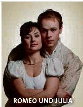
ROMEO UND JULIA