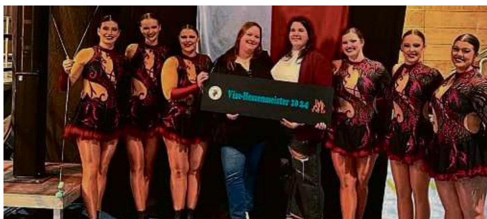
Toller Erfolg: Die Steinheimer Delphines haben den Vizemeistertitel bei der Hessenmeisterschaft errungen.