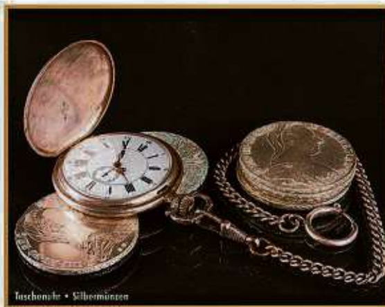
Faschante • Silbermünzen

aus dem Tresor zu holen und diese den Experten vorzulegen. Laut Experten kann beispielsweise eine Rolex GMT Master aus den 70er Jahren bis zu 9.000 EUR erzielen. Des Weiteren bieten die Experten von »Bares für Wa(h)res« kostenlose Wertschätzung von Diamanten an. Besonders interessant sind Diamanten im Brillantschliff ab einer Größe von 0,50 Carat. Hier gilt immer die Faustregel: ein einzelner großer Diamant ist wertvoller als viele kleine Diamanten. Ein Besuch bei den Experten lohnt sich in jedem Fall, denn hier wird Ihr Schatz professionell taxiert und zu einem fairen Preis entgegengenommen.