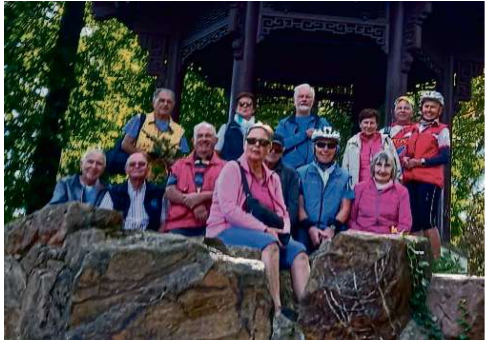
Die Seniorenradler in Bruchköbel gehören zu den eifrigsten Pedaleuren: Diese Saison stehen wieder einige längere Touren an.

Zum Start des Stadtradelns am heutigen Samstag ist eine kreisweite Auftaktveranstal-