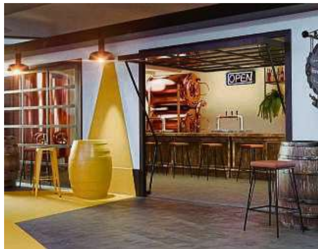
So könnte die Feierabend-Kneipe mit Brauerei-Flair aussehen. Ein Betreiber wird noch gesucht.

Da ist etwa von einem Shop die Rede, in dem ein Start-up Designerkleidung präsentiert, oder von einem Uhrenstand mit Schauwerkstatt. In kunstvollem Ambiente soll in einem anderen Shop alles rund um Zahnhygiene angeboten werden. Es könnte außerdem eine Ladeneinheit