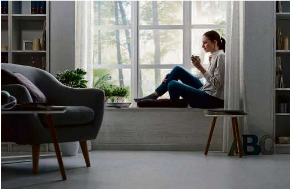
Kleine Dekoartikel machen den Lieblingsplatz noch wohnlicher.

Oft muss man diese Plätze als Stauraum nutzen, obwohl man sich am liebsten gerade hier unter eine Decke kuscheln und lesen möchte. Man kann tatsächlich beides haben. Aufklappbare Bänke oder solche mit Schubladen bieten genug Raum, um allerlei Krimskrams zu verstauen. Muss man noch etwas mehr unterbringen, stellt man statt der Bank eine stabile Kommode auf, die das Körpergewicht aushält und ei-