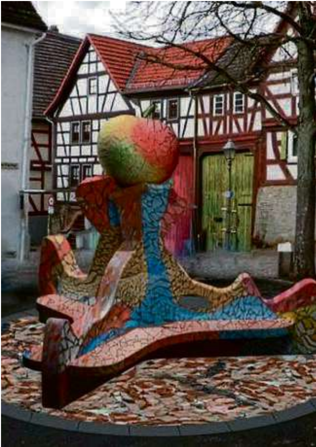
Eine mit Mosaiksteinen gestaltete Sitzskulptur mit Apfel soll den Mittelpunkt Maintals zieren.

Maintal – Die Entscheidung für ein Kunstwerk, das noch in diesem Jahr an Maintals geografischer Mitte aufgestellt werden soll, ist per Bürgervotum gefallen: Die Mehrheit der Abstimmenden hat sich für den Entwurf „Der Apfel thront“ ausgesprochen.