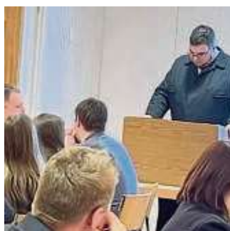
Lässt das vergangene Jahr Revue passieren: Der Förderverein der Rembrücker Feuerwehr.

Der Abteilungsvorstand erinnerte an einen Einsatz im März 2023, bei dem die Wehr zu einem Zimmerbrand im Zeisigweg gerufen wurde. Dort stand ein Sessel in Flammen. Anfang Juli erlebten die Freiwilligen dann einen nicht alltäglichen Einsatz: Nachdem Spaziergänger eine 250-Kilo schwere Brandbombe nahe der Gaststätte Wildhof gefunden hatten (wir berichteten), musste das Quartier