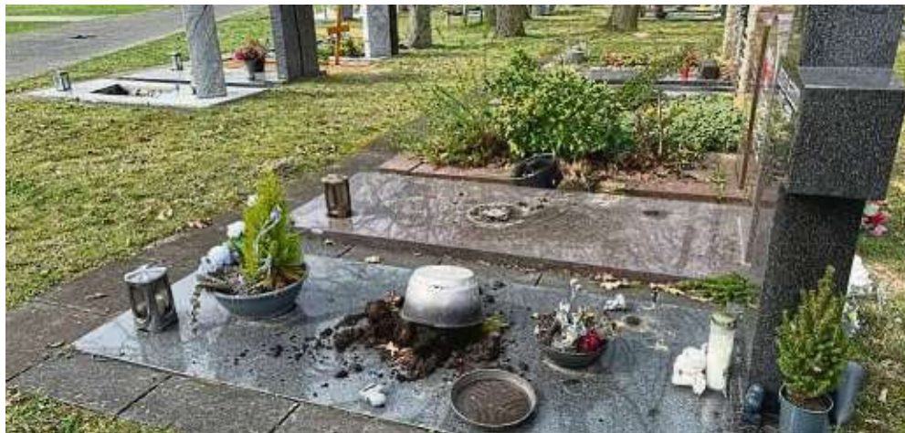
Trauriger Anblick: Möglicherweise ist dieses Grab vom Schmuckraub auf dem Friedhof „Im Birkengrund“ betroffen. Das Gros der anderen Gräber des Friedhofs wirken am Freitag indes unbeschadet und gepflegt.

Alles wirkt, als ob dieser Grabschmuckdiebstahl eine strategische Aktion war – und kein Einzelfall. Eine schnelle Internetrecherche ergibt ei-