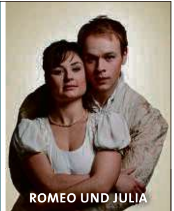
ROMEO UND JULIA