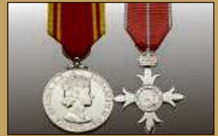
Medaillen / Orden