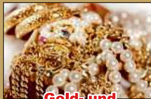
Gold- und Silberschmuck