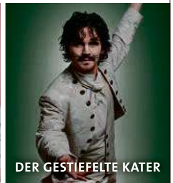
DER GESTIEFELTE KATER

Präsentiert von: Hilf Radio FFH Hanauer Anzeiger