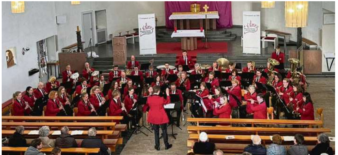
In seinen Bann zieht das Blasorchester der TSV Heusenstamm die Zuhörerinnen und Zuhörer in der Pfarrkirche Maria Himmelskron mit Stücken von Händel, Jacob von Haan sowie verschiedenen Chorälen.

Heusenstamm – Der Schuljahrgang 1944/45 trifft sich am Dienstag, 16. April, um 15 Uhr im Restaurant „Alter Bahnhof“ am Bahnhofspatz. jb