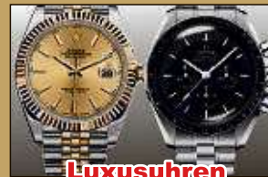
Luxusuhren aller Art