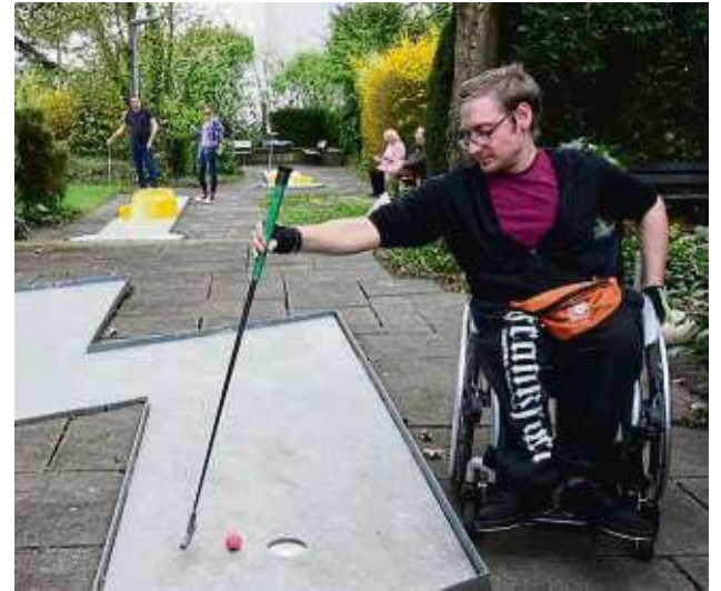
Minigolf ist auch ein inklusives Hobby, dem man auf den Bahnen in Hausen frönen kann.