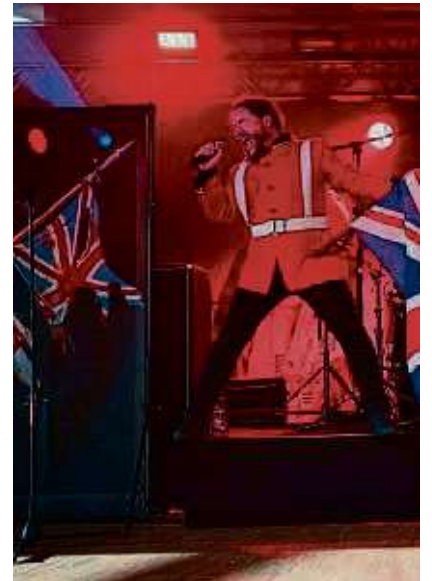
Die Band 667 rockt das Zoom.

Der Verlag beachtet bei der Verwendung der Daten die datenschutzrechtlichen Bestimmungen. Sie werden nur für die Zwecke des Gewinnspiels verarbeitet, nicht an Dritte weitergegeben. red