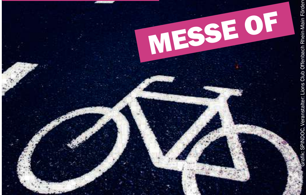
Grafik: SPINDOC, Veranstalter: Lions Club Offenbach Rhein-Main Förderverein e.V.

Annahme von 9 bis 12 Uhr Verkauf von 12.30 bis 15 Uhr