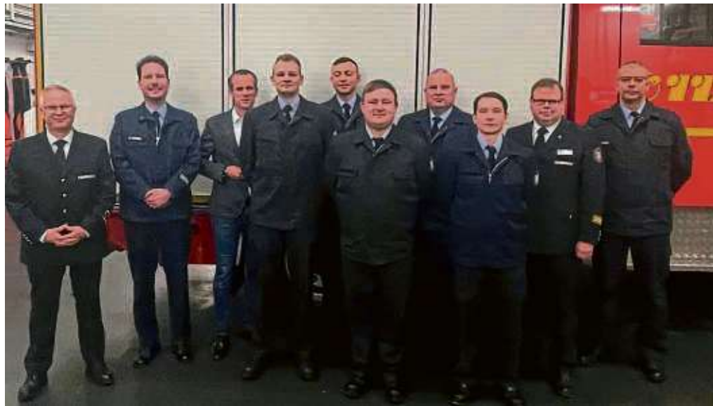
Beförderungen gab es für diese Aktiven der Freiwilligen Feuerwehr Rumpenheim.