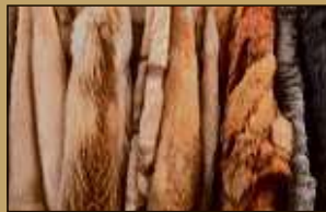
Pelze aller Art

Machen Sie Ihren Pelz und Ihr Gold zu Bargeld!