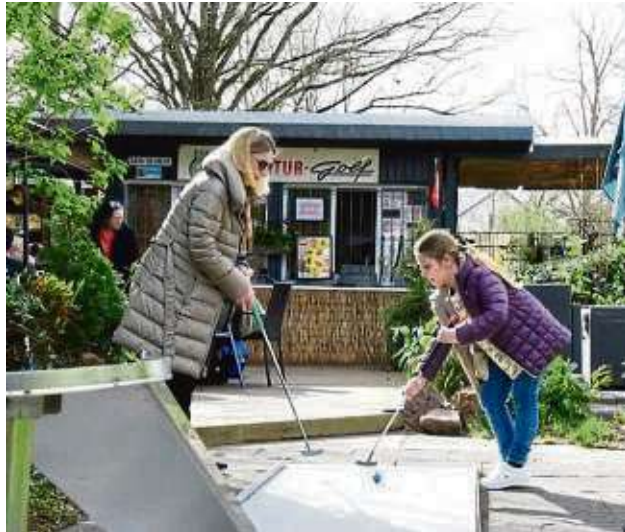
Minigolf ist ein Spaß für Jung und Alt - und für zwischen- durch gibt es eine Erfrischung am Kiosk.