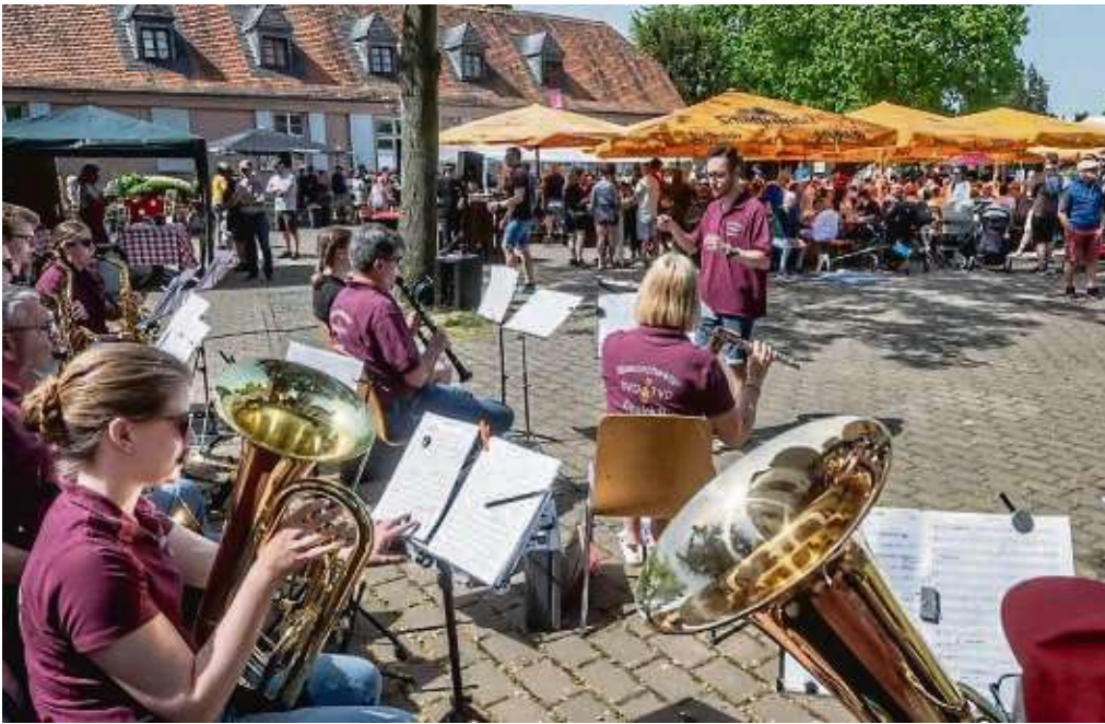
Superstimmung herrschte im Burggarten, wo das Bläserorchester Dreieich flott aufspielte. Das Familienfest der IG Haaner Kerbborsche lockte scharenweise Besucher an.