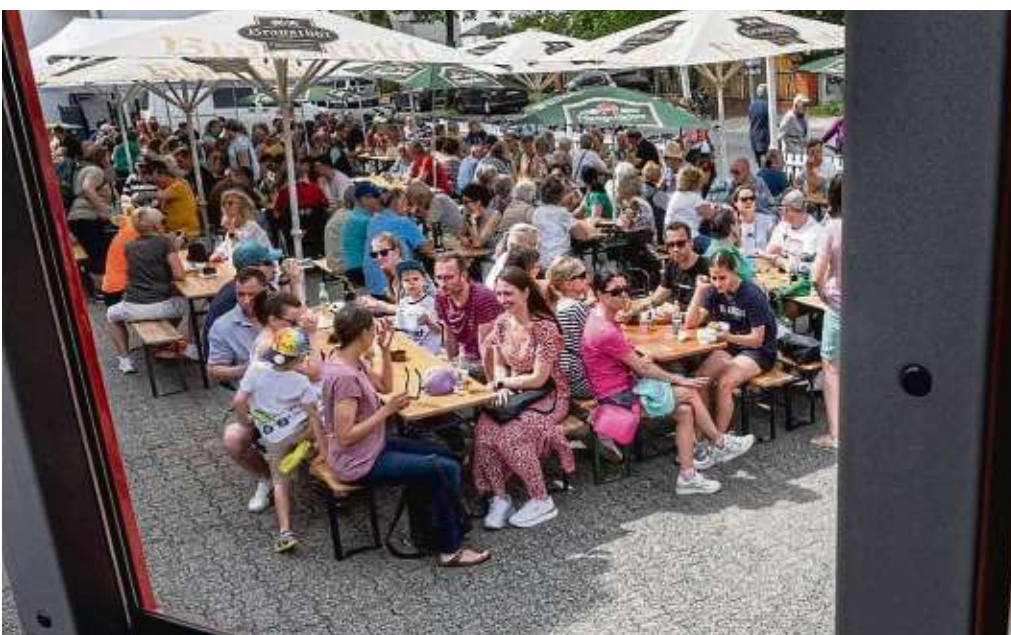
Knackevoll war der Biergarten der Götzenhainer Feuerwehr. Eine Fahrzeugausstellung und ein Kinderprogramm rundeten das Fest ab.