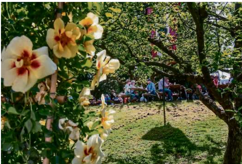
Beim Frühlingsfest im Lehrgarten des OGV Sprendlingen verbrachten die Besucher gesellige Stunden in malerischer Umgebung.