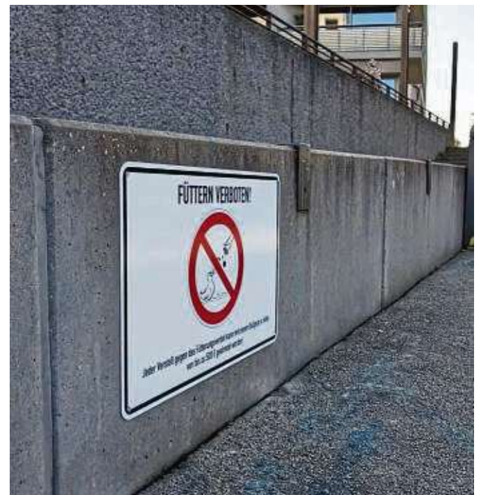
Ob's etwas bewirkt? So wie hier an der Hafentreppe sind weitere Verbotsschilder auch am Mainufer aufgehängt.

Das Ordnungsamt wird auch in diesem Jahr mit seiner Stadtpolizei regelmäßig Kontrollen durchführen und Verstöße gegen das Fütterungsverbot ahnden. pso