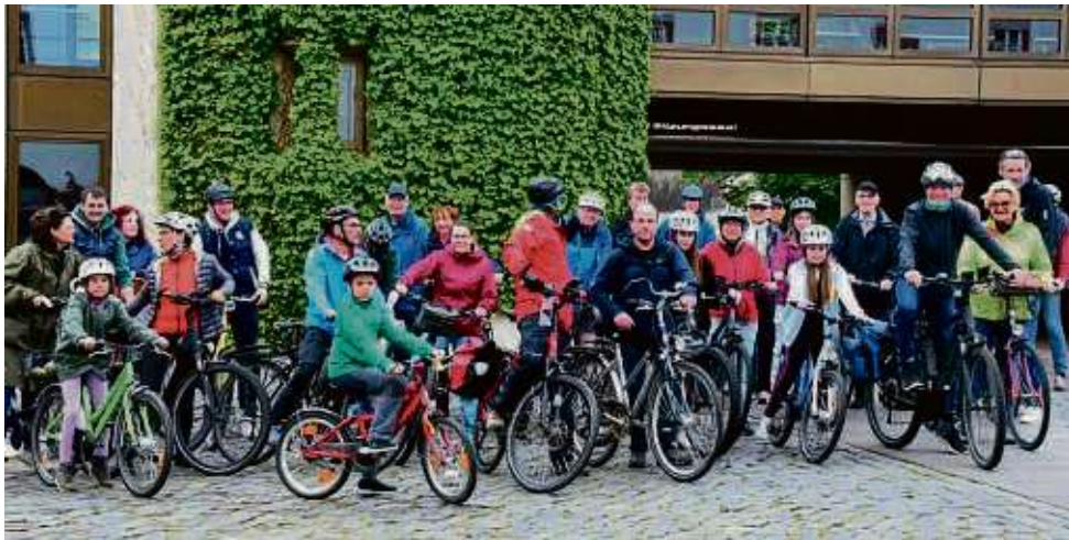
Radtour zum Auftakt: Rund 30 Personen haben gemeinsam mit Bürgermeister Steffen Ball (Sechster von links) das Stadtradeln mit einem Ausflug gestartet.

Mit den amtlichen Bekanntmachungen der Stadt Heusenstamm