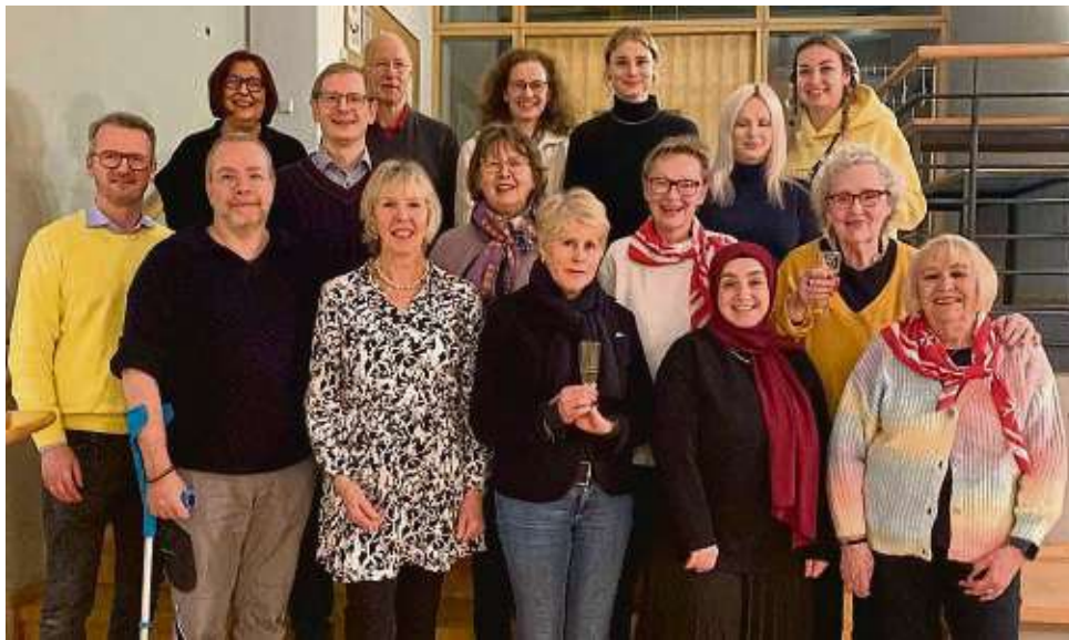
Ein gewachsenes Team, auch wenn auf dem Bild einige fehlen. Als die Malteserpraxis vor fünf Jahren ihre Arbeit aufnahm, bestand sie aus drei Ärzten und sechs Helfern – heute teilen sich 21 Leute die Dienste untereinander auf.