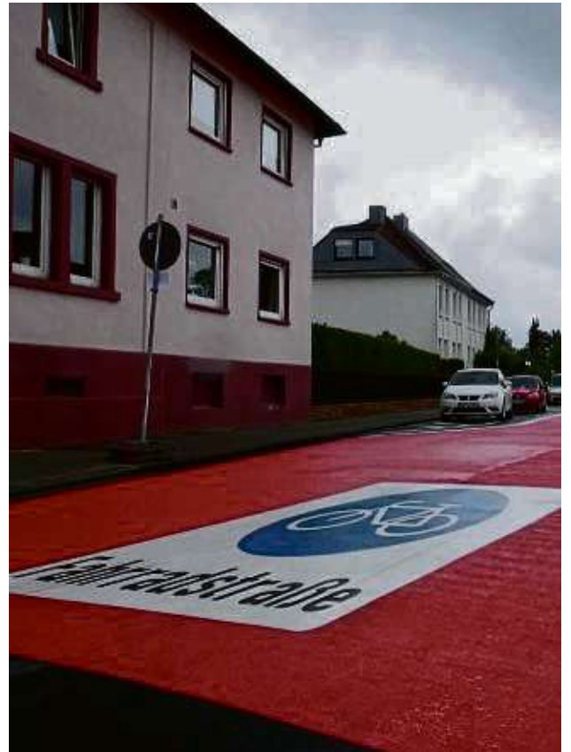
Die Markierungen sind angebracht, die Beschilderung fehlt noch: Der Umbau zur Fahrradstraße auf der Patershäuser Straße ist fast abgeschlossen.

Infos im Internet stadtradeln.de/ heusenstamm