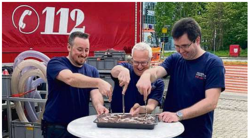
Vorfriede auf Leckerem beim Familientag der Freiwilligen Feuerwehr Waldheim.