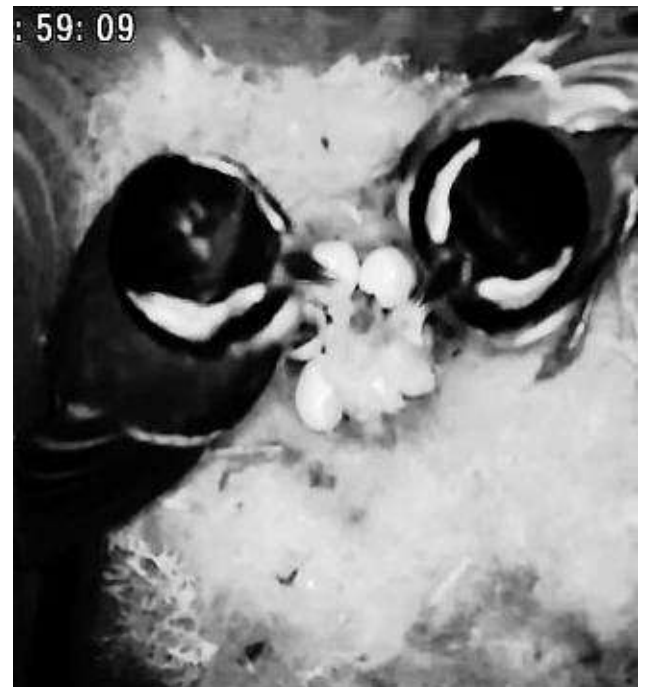
Beide Eltern-Vögel sind dabei, als die ersten Kohlmeisen-Küken schlüpfen.

kann über heusenstammwetter.de aufgerufen werden.