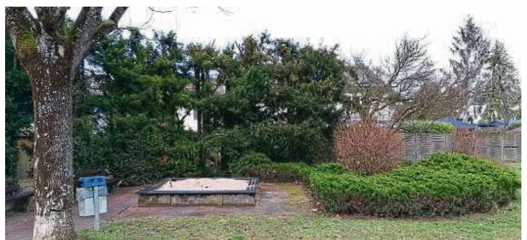
Veraltet und wenig einladend: Der Spielplatz am Scheffelplatz soll aufwendig modernisiert und erweitert werden.

Die Idee ist, durch geschwungene Form der Wege, Spiel- und Pflanzflächen, Geländemodellierung und Ein-