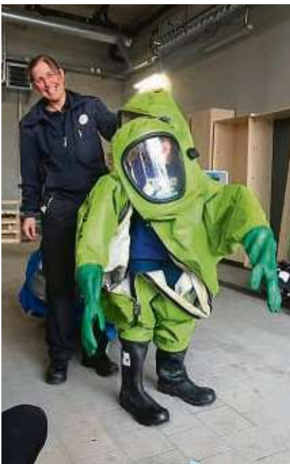
Passt nicht so ganz, Spaß hat es bei der Feuerwehr aber trotzdem gemacht.

Ausstattung, etwa Schutzweste und Handschellen.