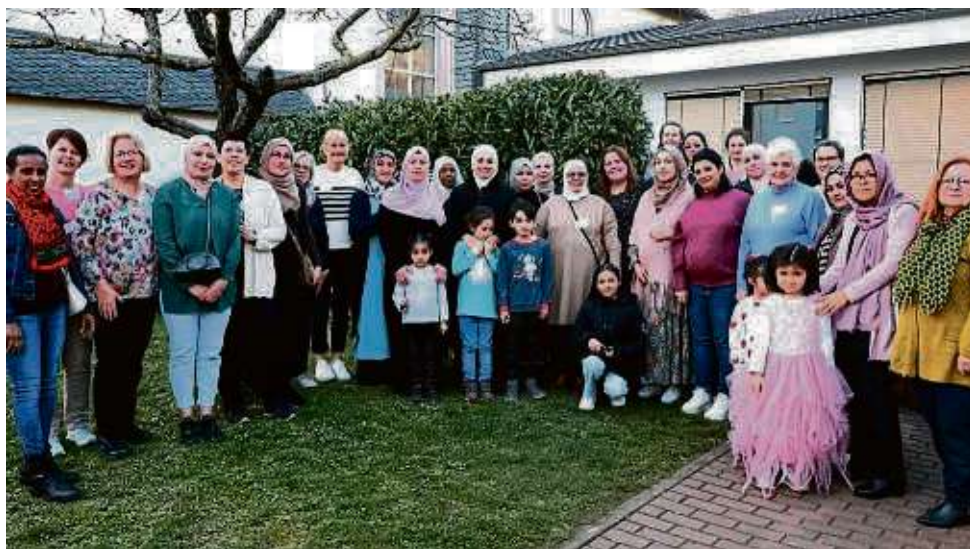
Viele Freundschaften sind seit 2011 im Frauencafé der CFEE entstanden. Die Gruppe trifft sich einmal im Monat.