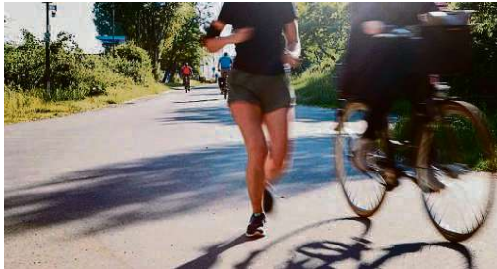
Bewegung unter freiem Himmel ist für die Gesundheitsförderung von zentraler Bedeutung.

„Sport und Bewegung sind für die Gesundheitsförderung von zentraler Bedeutung“, betont Bürgermeisterin und Gesundheitsdezernentin Sabine Groß. „Vor drei Jahren haben wir eine Koordinierungsstelle für Gesundheitsförderung und Prävention beim Gesundheitsamt ein-