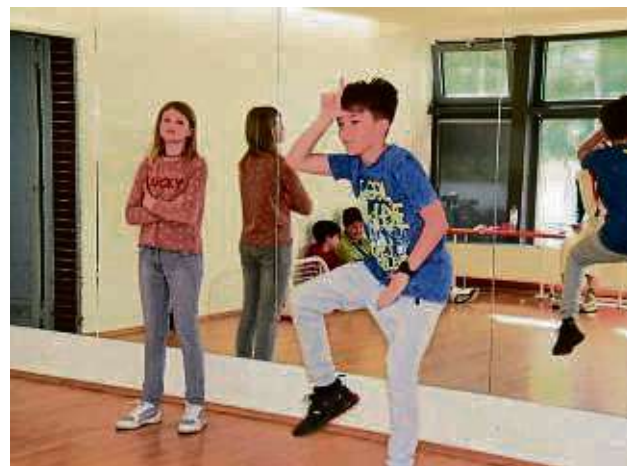
Ihrer Kreativität freien Lauf ließen die Kinder bei der Erarbeitung einer Tanzchoreografie.

in Ekstase und gibt einem Jungen dabei aus Versehen vermeintlich eine Ohrfeige, sodass er theatralisch zu Boden geht.