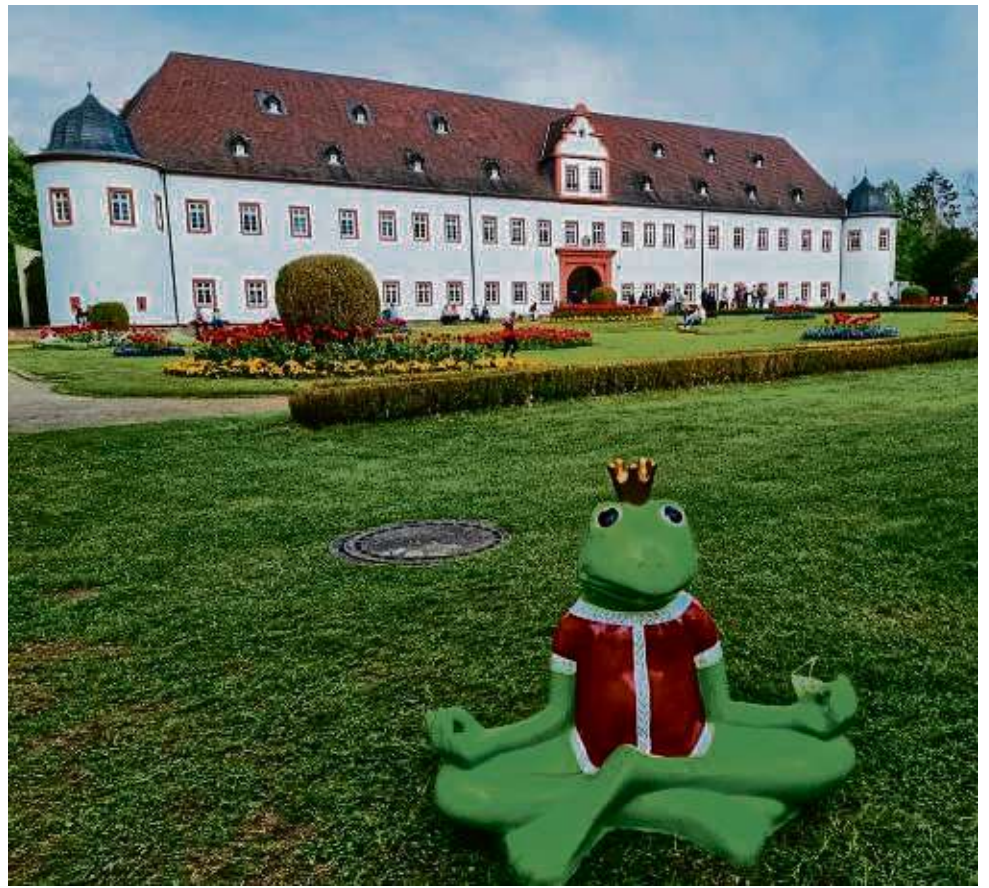
Auf dem Schlossgelände, Im Herrngarten 1, präsentieren sich vom 26. bis 28. April, über 120 Aussteller.