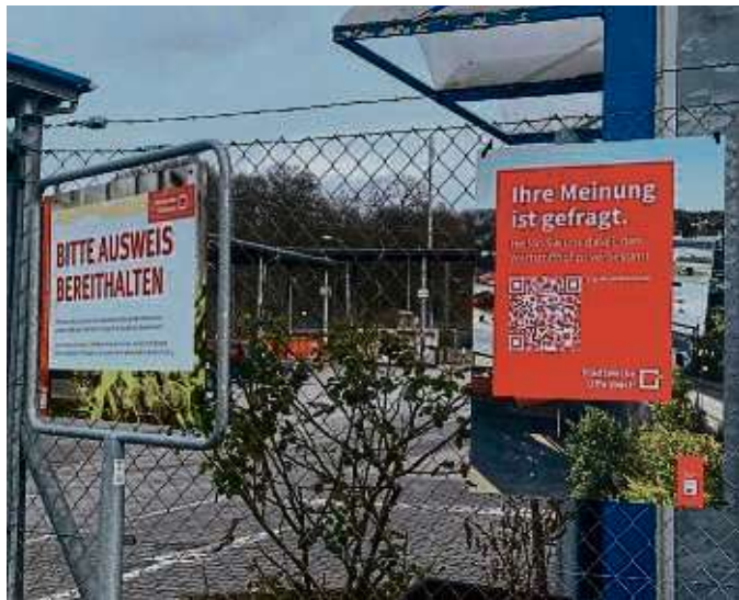
Am Wertstoffhof an der Daimlerstraße können Anlieferer Fragen nach ihrer Zufriedenheit beantworten.