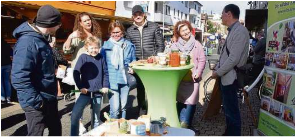
Die „Wilden Zwerge“ und „Die Zwergenkinder“ luden auf dem Mühlheimer Wochenmarkt zur Präsentation des Projektes „Faire/nachhaltige Kita“ ein.

Die Kinder haben beispielsweise aus Tetrapacks Blumentöpfe gebastelt, sie angemalt und bepflanzt. In einem anderen Projekt haben die