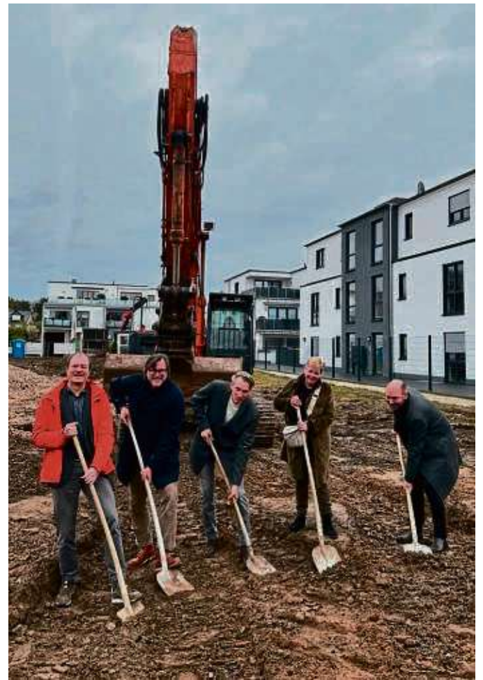
Spatenstich auf dem Gelände der ehemaligen Schreinerei Ebert: An der Robert-Koch-Straße 8 entstehen bis Ende 2025 34 Eigentumswohnungen, einige davon sind für betreutes Wohnen vorgesehen.

Die Kombination aus anteiligen zinsgünstigen KfW-Darlehen in Höhe von 100 000 Euro und den günstigen Verkaufspreisen, die sich aus dem Erbbaurechtsmodell ergeben, ermöglicht es vielen Interessenten, sich doch noch eine klimafreundliche Neubau-Eigentumswohnung leisten zu können. Bauleiter Jochen Mergili rechnet mit der Fertigstellung der Wohnungen bis Ende 2025.