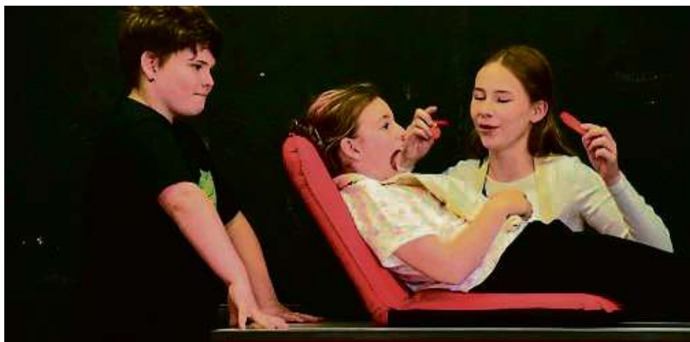
Keine Angst vorm Zahnarzt – oder doch? Einige Kinder hatten während der Ferienspielwoche ein eigenes Theaterstück einstudiert, das sie jüngst aufführten.

Kontakt: vhs Kreis Offenbach Frankfurter Str. 160-166 63303 Dreieich 06103 3131-1313 vhs@kreis-offenbach.de