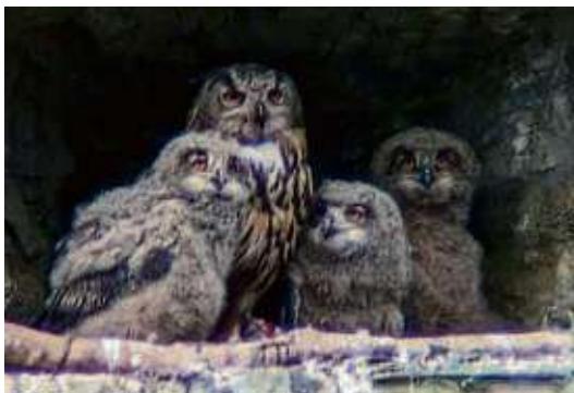
Die Junguhus mit Mama Charlotte

KÖNIGSTEIN (red) – Fotografin Anne Pfenninger hat der Stadt wieder wunderschöne Fotos der drei Uhu-Wonnepoppen gesendet, die zurzeit auf der Königsteiner Burg aufwachsen. Der Uhuvater, den die Fangemeinde „Leopold“ nennt, bringt genug Futter für die drei Junguhus und für das Uhuweibchen, „Charlotte“ genannt, ins Nest. Das Ergebnis: Die Junguhus wachsen schnell. Wenn sie sich strecken, werden die langen kräftigen Beine unter dem Federkleid sichtbar. Augenscheinlich sind sie agil und die Wildtiere beginnen mit ersten Flügelschlagübungen. Die großen Schwungfedern sind dabei schon gut zu erken-