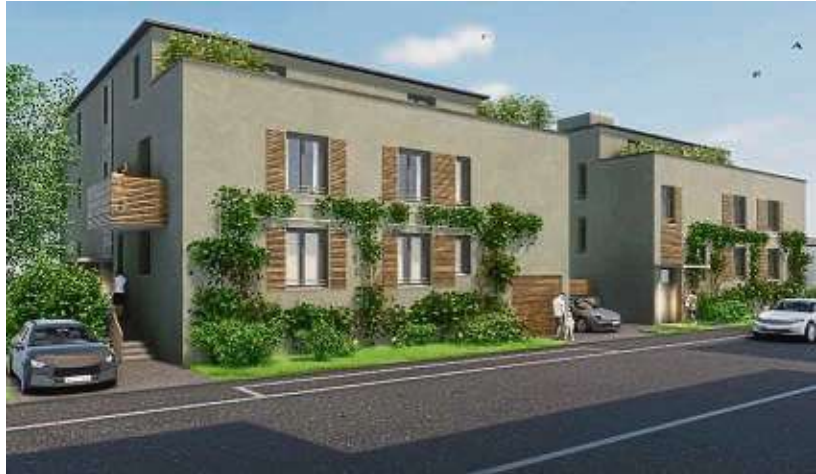
Bei den Gebäuden handelt es sich um dreistöckige Baukörper, wobei das oberste Geschoss als Staffelgeschoss ausgewiesen ist.

„Wir haben sehr genau geprüft, ob Qualität und Architektur, die der HWB bei all ihren Projekten sehr wichtig sind, vor dem Hintergrund der veränderten Rahmenbedingungen reduziert geplant werden können, und sind nun sehr froh, dass