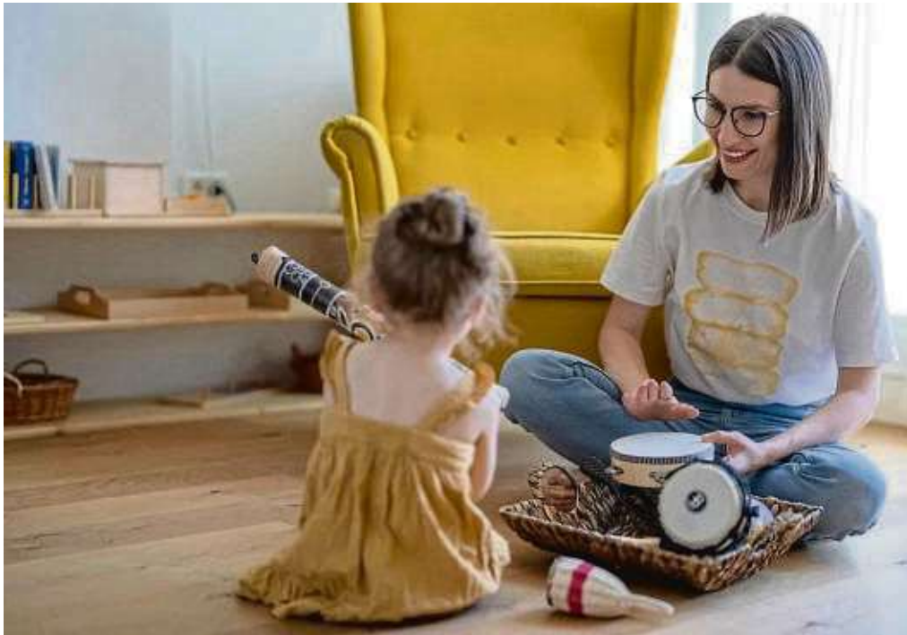
Tagespflege ist eine sehr anspruchsvolle Arbeit.