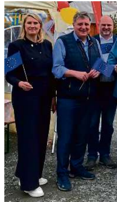
Strahlende Gesichter auch bei der poli...

Wie sehr der europäische Gedanke aber auch bedroht ist, wurde am Stand der Ukrainehilfe-Taunus deutlich. Der auf Initiative