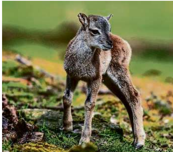
Ein junger Mufflon erkundet die Welt.

KRONBERG (red) – Das Mufflon hat ein riesiges Verbreitungsgebiet in Europa und Asien. Es war vor der letzten Eiszeit auch in Mitteleuropa heimisch, wurde aber durch das kalte Klima bis in den Mittelmeerraum verdrängt. Erst im 19. Jahrhundert wurde es wieder als Wildtier in Deutschland angesiedelt. Wie auch im Opel-Zoo zu sehen, leben die Mufflons in Herden. Sie kommen im hügeligen Bergland bis in 4.000 Metern Höhe vor. Während der Paarungszeit im November streiten sich die Männchen um die Weibchen mit einem eindrucksvollen Rammkampf. Zwei Widder rennen aufeinander zu und prallen krachend mit den Hörnern aneinander. Nach einer Tragzeit von fünf Monaten kommen dann die Jungtiere zur Welt und genau diese sind jetzt im Opel-Zoo zu sehen: Im März und April wurden insgesamt sechs Lämmer