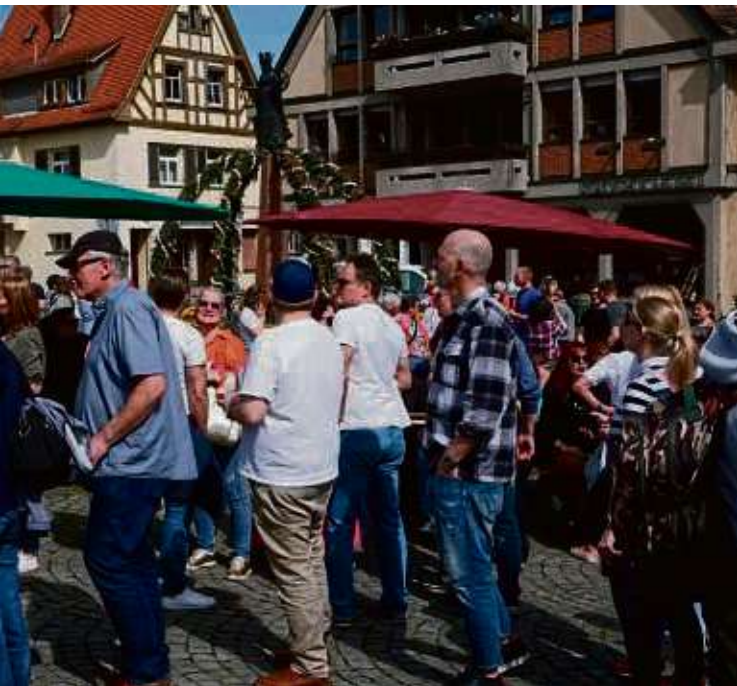
on des Oberurseler Altstadtmarktes