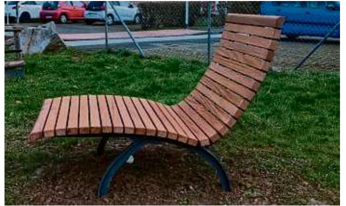
Eine der Ruhebänke im Park Sindlinger Wiesen

KELKHEIM (red) – Pünktlich zum Frühlingsstart hat der Bauhof zwei neue Liegebänke im Stadtpark „Sindlinger Wiesen“ in Kelkheim-Münster installiert. „Damit alle eine Pause auf der Bank genießen können, bitten wir euch, die Fläche sauber zu halten“, so die Verwaltung. An der Ecke Altkönigsstraße/Fischbacher Straße wurden eine neue Trockenmauer aus Muschelkalk-Mauersteinen errichtet und Findlinge gesetzt. Hier haben Lavendel, Thymian, Salbei, Goldgarbe und Lupinenarten eine neue Heimat gefunden. „Die Pflanzen werden bis zum Sommer dank der liebevollen Pflege unserer städtischen Gärtner groß