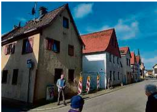
Franz Jirasek vor dem Haus in der Goethestraße 8 im Gespräch mit Anwohnerinnen.

KRIFTEL (red) – Das gemeindeeigene Grundstück in der Goethestraße 8 ist mit einem kleinen zweigeschossigen Wohngebäude bebaut, vermutlich aus der Mitte des 18. Jahrhunderts. Es liegt im historischen Ortszentrum der Gemeinde und ist als Kulturdenkmal in das Denkmalverzeichnis des Landes Hessen eingetragen. Bei einem Brand am 5. Juni 2023 wurde es beschädigt und steht momentan leer. „Wir möchten das Grundstück nun veräußern“, so der Erste Beigeordnete Franz Jirasek. Der Gemeindevorstand sei nach eingehender Prüfung zu der Erkenntnis gelangt, dass sich eine Sanierung des Gebäu-