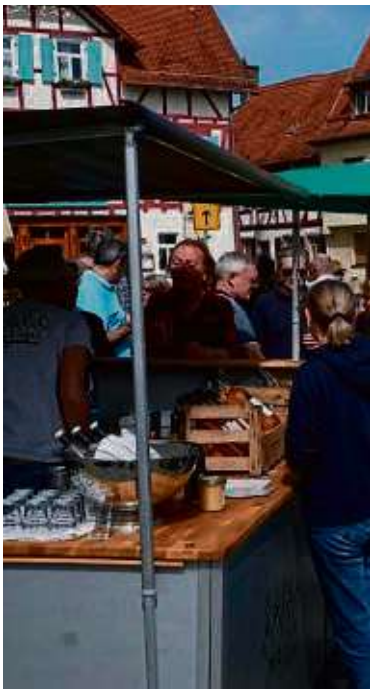
Andrang beim Auftakt zur dritten Saison