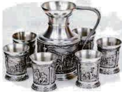
Zinnkrug und Zinnbecher