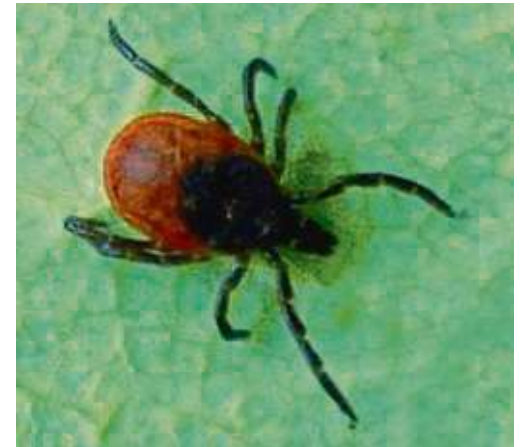
Ab acht Grad Celsius krabbeln die Zecken aus ihren Winterquartieren hervor.

zuletzt an den Leitlinien mitgearbeitet. „Zum anderen gibt es Probleme mit der Kassenärztlichen Vereinigung, die dem Arzt Regresse androht, wenn die Therapie zu teuer wird“, weiß Fischer, die selbst 20 Fachbücher über Borreliose geschrieben hat. Regelmäßig veröffentlicht der Verein die Zeitschrift „Borreliose Wissen“.