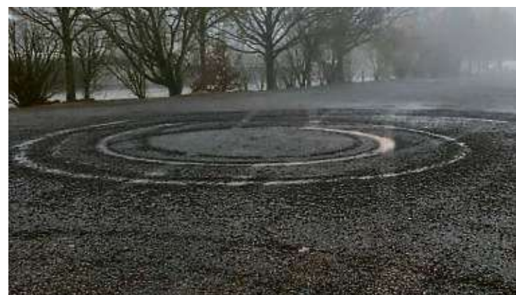
Gerade saniert und wieder zerstört: Eine unbekannte Person hat den frisch sanierten Festplatz in Bremthal beschädigt.