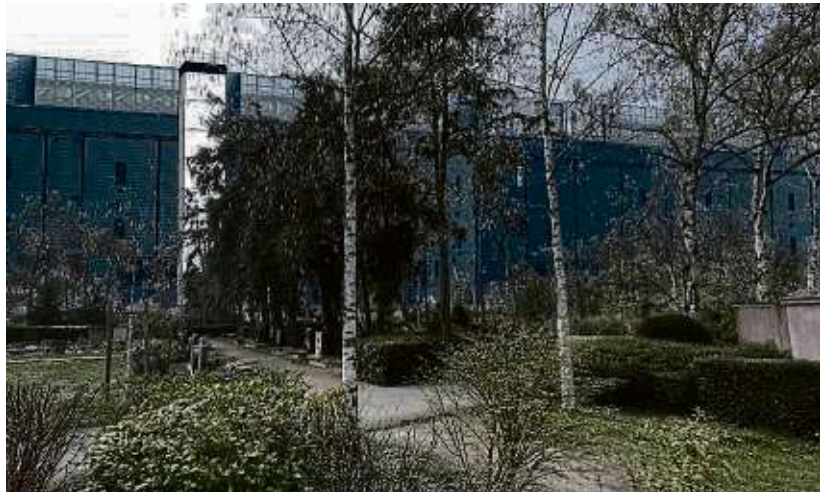
Die Friedhofsruhe werde durch den Bau und den Betrieb der Rechenzentren wie auf dem Foto am Friedhof Mitte gestört, moniert die Bürgerinitiative BiENE.

HATTERSHEIM (red) – „Elf Rechenzentren sind genug!“ sagt die „Bürgerinitiative im Einsatz für Naturerhalt“ (BiENE) und argumentiert: „In den letzten Jahren wurden in Hattersheim sieben Rechenzentren in Betrieb genommen, vier weitere werden gerade gebaut. Nun wollen der Bürgermeister und die Stadtverordneten den Bau von drei weiteren Rechenzentren beschließen. Sie sollen direkt an den Friedhof und an ein Wohngebiet angrenzen. Land, das als Vorbehaltsgebiet für besondere Klimafunktion und Grundwasserschutz und als Vorranggebiet für Landwirtschaft definiert ist, soll umgewidmet und versiegelt werden.“ „Die Friedhofsruhe würde durch den Bau und den Betrieb der Rechenzentren gestört“, merkt Maren Burkhardt von der Bürgerinitiative an. Nach Einschätzung von BiENE gibt es noch viele weitere negative Effekte für die Stadt und die Natur, wie andauernde Lärmbelastung und Beschallung,