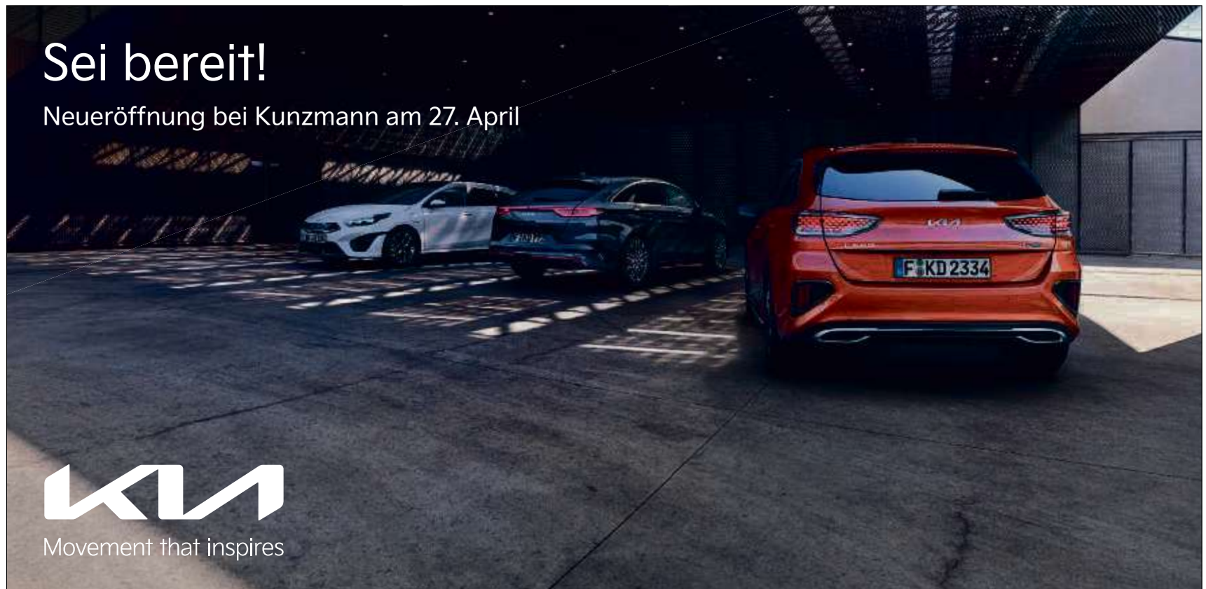
Abbildung zeigt kostenpflichtige Sonderausstattungen.

Mit dem Finale dürften – vorsichtig geschätzt – in den vergangenen 25 Jahren mehr als 30.000 Menschen am Kreisstadt-Lauf teilgenommen und sich die Gesamteinnahmen für Leberrecht auf über 350.000 Euro summiert haben.