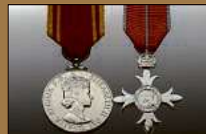
Medaillen / Orden