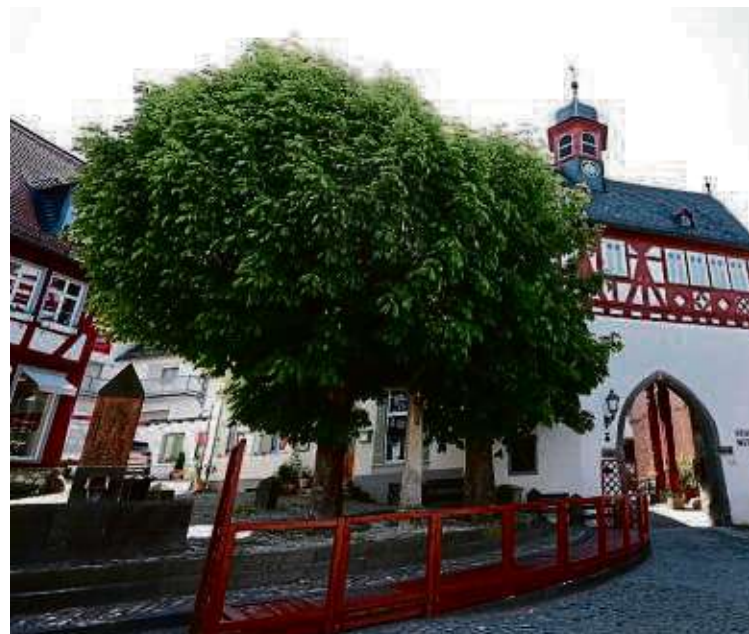
Das Heimatmuseum im Alten Rathaus wurde vom Verein zunächst einmal ges...