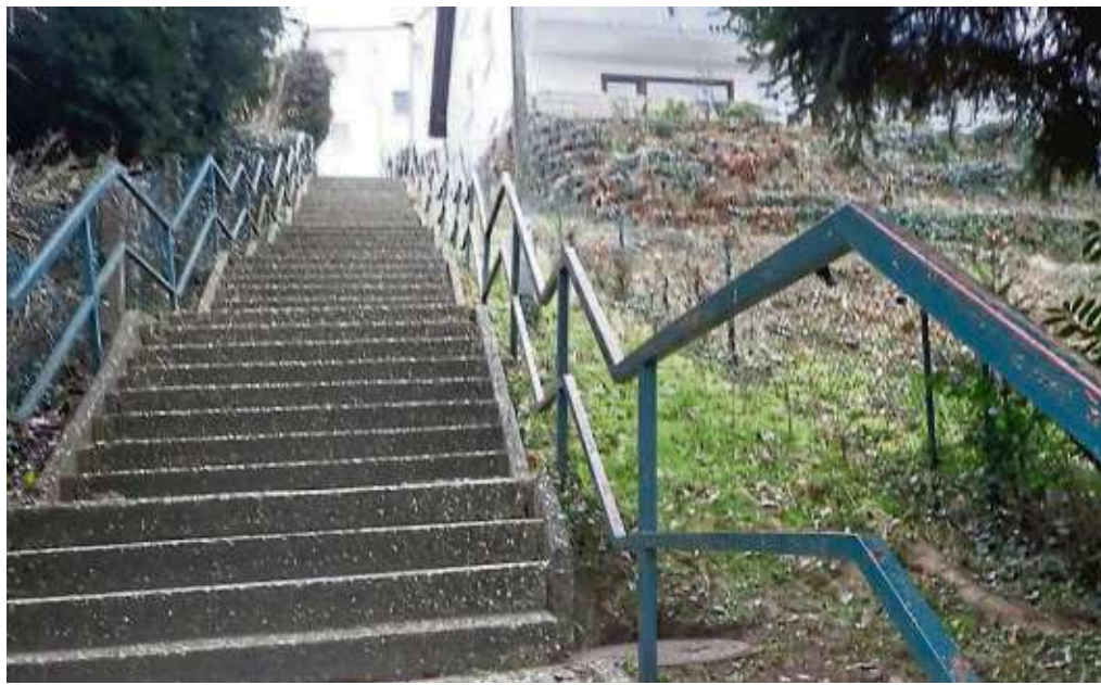
Wacklige Stufen, rostige Handläufe: Im Herbst wird alles besser sein.

Aber: Die Stufen sind in die Jahre gekommen, der Beton bröckelt. Deshalb soll die Treppe ab den Sommerferien komplett erneuert werden. Die Bauarbeiten werden rund vier Monate dauern – leider über die Zeit der Sommerferien hinaus. Die teilweise wackligen Blockstufen werden entfernt und ebenso wie die rostigen Handläufe gegen neue ausgetauscht. Außerdem muss der Grund unter den Stufen erneuert werden. Damit die Arbeiten im Sommer zügig und reibungslos vorantreiben können, müssen Vorkehrungen getroffen werden. So wird eine Fachfirma den Baugrund untersuchen, um beispielsweise abzuschätzen, wie das bei den Arbeiten entnommene Material deponiert