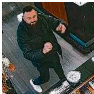
Die Polizei sucht diesen Mann.

SULZBACH (red) – Ein Unbekannter...betrat am Freitag, 3. November...2023, gegen 12 Uhr ein Juweliere...geschäft im MTZ und ließ sich von...einem Verkäufer hochwertige Uhren...zeigen. Während des Verkaufsges...prächs nahm der Dieb plötzlich...die Uhren im Wert von mehr als...24.000 Euro an sich und flüchtete...in unbekannter Richtung. Von dem...Unbekannten konnten Lichtbilder...gefertigt werden. Mit diesen Bildern...fahndet die Polizei nun nach dem...Täter. Er wird beschrieben als...circa 1,70 Meter bis 1,80 Meter...groß, mit südosteuropäischem...Phänotyp, mit dunklem Vollbart...und „Boxer“-Haarschnitt. Der Mann...war bekleidet mit einer blauen...Steppjacke mit weißer Aufschrift...auf dem linken Oberarm, einer...dunklen Hose, weißen Sneakers...mit schwarzem Emblem auf der...Schuhrückseite. Wer Angaben zur...Person machen kann, wird gebeten...sich bei der Polizei in Eschborn...unter ☎ 06196 9695-0 zu melden.