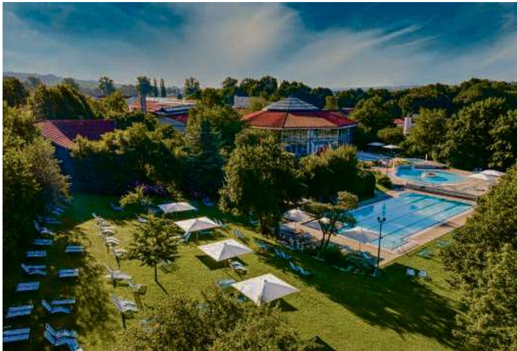
Fit in den Frühling mit dem Heilwasser der Rottal Terme in Bad Birnbach - dem ländlichen Bad im Südosten Bayerns.

Bad Birnbach. Im südöstlichen Niederbayern, zwischen Donau, Rott und Inn, pulsiert seit 50 Jahren unermüdlich dampfend heißes Heilwasser aus den Tiefen des Urgesteins. Genau hier liegt Bad Birnbach, das ländliche Bad. Ein Blick zurück: Viele Menschen versammelten sich damals an einem Bohrloch inmitten einer grünen Wiese. Langsam trat heißes, dampfendes Wasser aus der Erde, nachdem ein Bohrkopf bis in 1.618 Meter Tiefe des Urgesteins vorgegrungen war und auf 70 Grad heißes und hoch mineralisiertes Thermalwasser stieß. Dieser Tag markierte den Beginn einer Erfolgsgeschichte, die noch heute andauert: Es war die Geburtsstunde des ländlichen Bades. Die Quelle wurde nach dem Ortsheiligen Chrysantus getauft. Der heilende Effekt wurde längst wissenschaftlich durch Prof. Dr. Heinrich Drexel vom Institut für medizinische Balneologie und Klimatologie der Universität München verbrieft. Fünf Jahrzehnte nach dem Fund weist die Rottal Terme mehr als 30 Becken mit einer Fläche von rund 2.600 m 2 auf. Hunderttausende Besucher haben