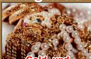
Gold- und Silberschmuck