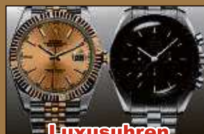
Luxusuhren aller Art