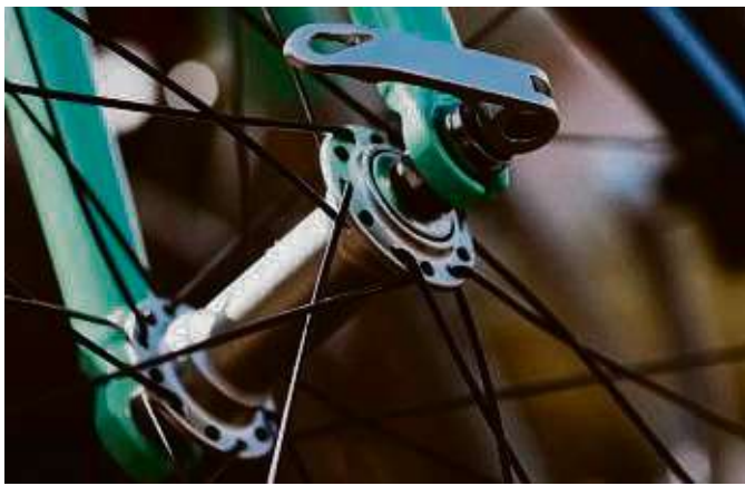
Anfang der Woche dreht sich in Eschborn alles ums Rad.

Am Montag, 25. März, werden von 10 bis 13 Uhr und von 14 bis 17 Uhr die gespendeten Fahrräder gesichtet und je nach Zustand Fahrradteile aus den Radspenden ausgebaut, gesammelt und sortiert, um sie als Ersatzteile für andere Fahrräder zu nutzen. Kinder und Jugendliche, die kein eigenes Fahrrad besitzen, können ein Spendenrad für die eigene Nutzung erhalten. Am Dienstag, 26. März,